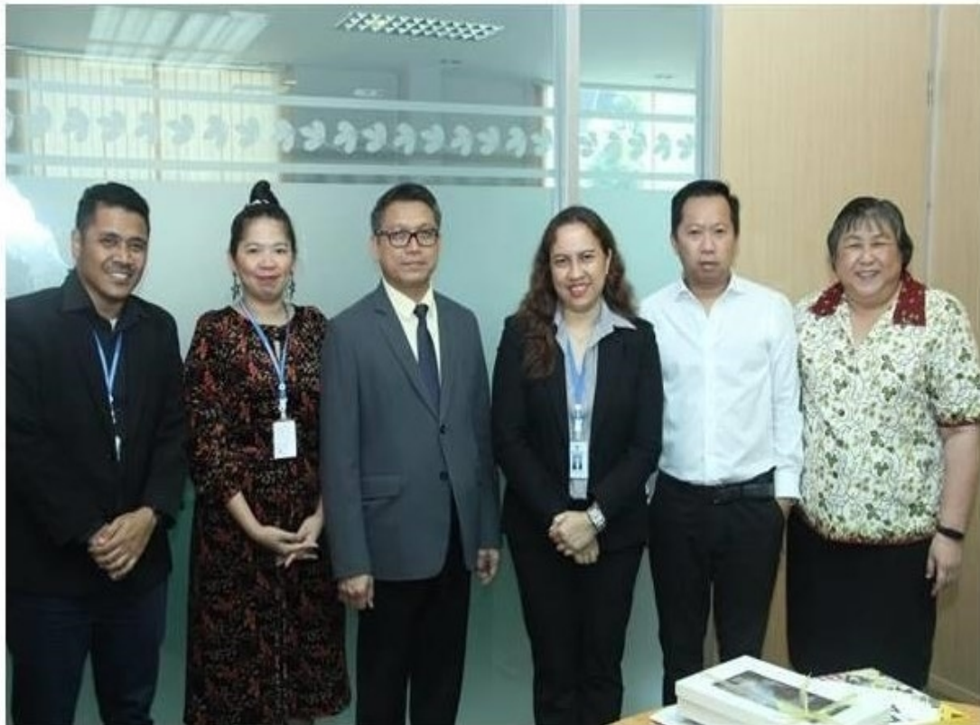
กรุงเทพฯ--13 ก.พ.--การยางแห่งประเทศไทย