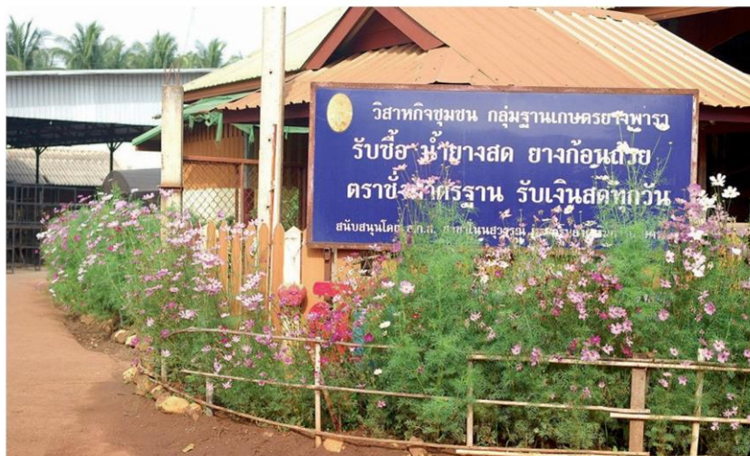
ที่ตั้งวิสาหกิจกลุ่มฐานเกษตรยางพาราบ้านโนนสุวรรณ