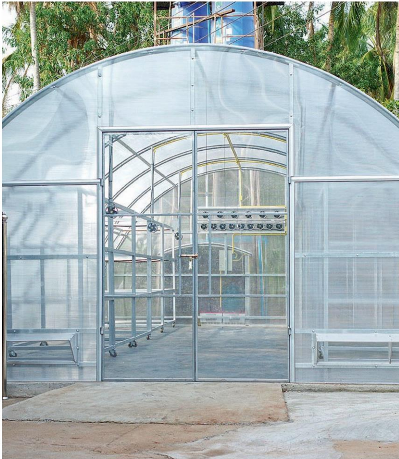
พาราโบล่าโดม หรือระบบอบแห้งแสงอาทิตย์เรือนกระจก

สิ่งที่คณะอาจารย์จากมหาวิทยาลัยศิลปากร และ พพ. ร่วมกันคิดค้นก็คือ “พาราโบล่าโดม” หรือ “ระบบอบแห้งยางด้วยพลังงานแสงอาทิตย์แบบเรือนกระจก” เป็นนวัตกรรมใหม่ล่าสุด สำหรับใช้อบแห้งยางพาราที่เป็นยางแผ่นดิบ แทนการรมควันด้วยไม้ฟืน เนื่องจากควันและความร้อนจากฟืน เป็นตัวทำลายผิวยางให้เสื่อมและทำให้ยางขาด