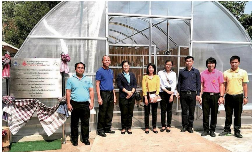
เสนอ ชูจันทร์ ผู้ตรวจกระทรวงเกษตรฯ ตรวจเยี่ยมกลุ่มฐานเกษตรฯ โนนสุวรรณ

"...แต่ก่อนไม่เคยรู้เลยว่าแสงอาทิตย์หรือแสงยูวีทำลายเซลล์ยางพาราได้เกิน 50% ถ้าเรตากยางตามธรรมชาติ ยกตัวอย่างยางเครพไม่เกิน 7 วัน ยางจะขาด แต่เมื่อนำมาตากหรืออบแห้งในพาราโบล่าโดม ผ่านแผ่นโพลีคาร์บอเนต ปรากฏว่ายางอยู่ได้นานขึ้น 1-2 เดือนก็ไม่ขาด เราไม่เคยรู้สิ่งนี้มาก่อน ถือว่าเป็นผลดีแก่ชาวสวนยางมาก เพราะปกติแล้วชาวสวนยางภาคอีสานนิยมผลิตยางก้อนถ้วย เป็นยางคุณภาพต่ำจึงไม่ไ้ราคา แต่ถ้าหากสามารถปรับเปลี่ยนมาแปรรูปเป็นยางแผ่นดิบ