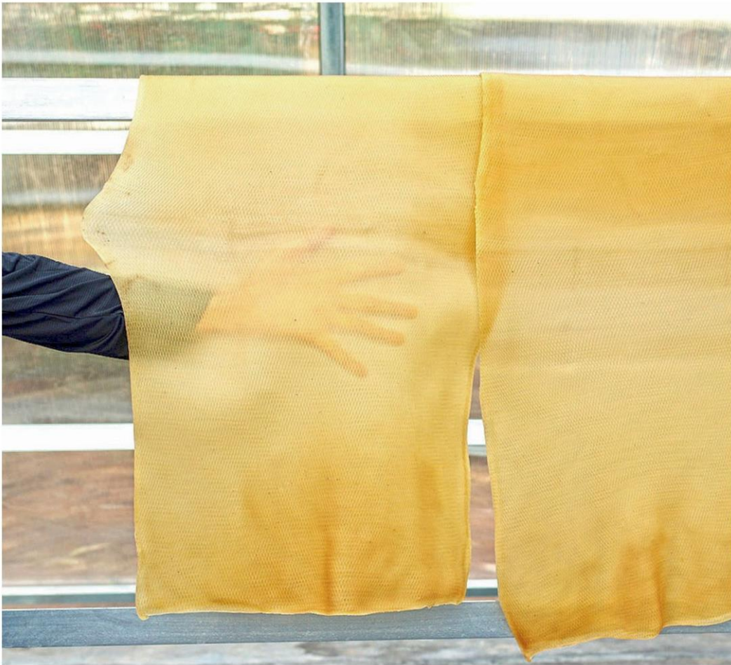
แผ่นยางที่แห้งสนิทแล้วจะใส สีสวย ไม่คล้ำ

พ ล.อ.ประยุทธ์ จันทร์โอชา นายกรัฐมนตรี หัวหน้าคณะรัฐบาลออกทีวีชี้แจงทางโทรทัศน์ เมื่อต้องเผชิญกับมือบปฎิหาราคายางตกต่ำ จากกลุ่มสหพันธ์เกษตรกรชาวสวนยางภาคใต้ ที่รวมตัวกันเมื่อเดือนมกราคม 2563 ทวงถามผู้มีอำนาจหน้าที่เกี่ยวข้องกับการแก้ไขปัญหาราคายาง ที่ถึงขณะนี้ยังไม่เียงหัวโตระดับขึ้นอย่างทีสัญญาเอาไว้ กลุ่มสหพันธ์ดังกล่าวมีการรวบรวมปัญหำนำเสนอให้รัฐบาลลงมือแก้ไขอย่างจริงจัง ไม่ใช่ปล่อยให้ปละละเลยมานานกว่า 7 ปีแล้ว