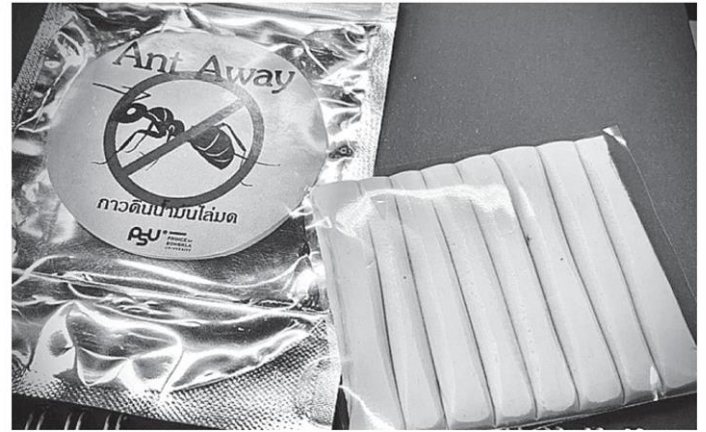
กว้างพารากลับสมุนไพรโล่มด ผลงานที่คิดค้นและพัฒนาขึ้นโดย ผศ.ดร.นริศ ท้าวจันทร์ มีประสิทธิภาพในการป้องกันมดได้นานถึง 3 เดือน

“เราทดลองกับมดน้ำตาลซึ่งเป็นมดที่เจอบ่อยในบ้าน ถ้ามีเศษอาหารร่วงพื้นก็จะมากินเร็วมาก ทดสอบโดยเอาอาหารวางไว้สองจุด จุดหนึ่งล้อมด้วยยางที่เราเติมสมุนไพร ส่วนอีกจุดล้อมด้วยยางที่ไม่ผสมอะไร ประมาณ 5-10 นาที ในล้อมยางที่ไม่ใส่สารจะมีมดมารุมกินอาหาร ส่วนที่ล้อมด้วยยางที่ผสมน้ำมันหอมระเหย มดไม่เข้ามากินอาหารเลย ทดสอบแบบนี้เดือนละครั้ง ทั้งไว้นาน 3 เดือน ก็ยังมี