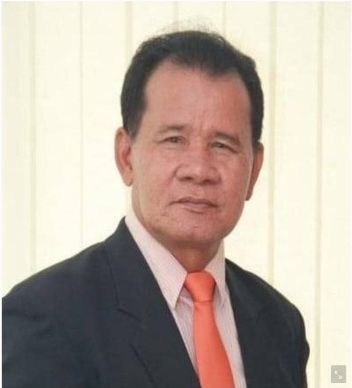
สังข์เวิน ทวดห้อย

หัวข้อข่าว: เปิดวิธีเช็คสิทธิ์ "ประกันภัยชาวสวนยาง" เสียชีวิต จ่าย รายละเอียด 5 แสหนบาท | ฐานเศรษฐกิจ | LINE TODAY