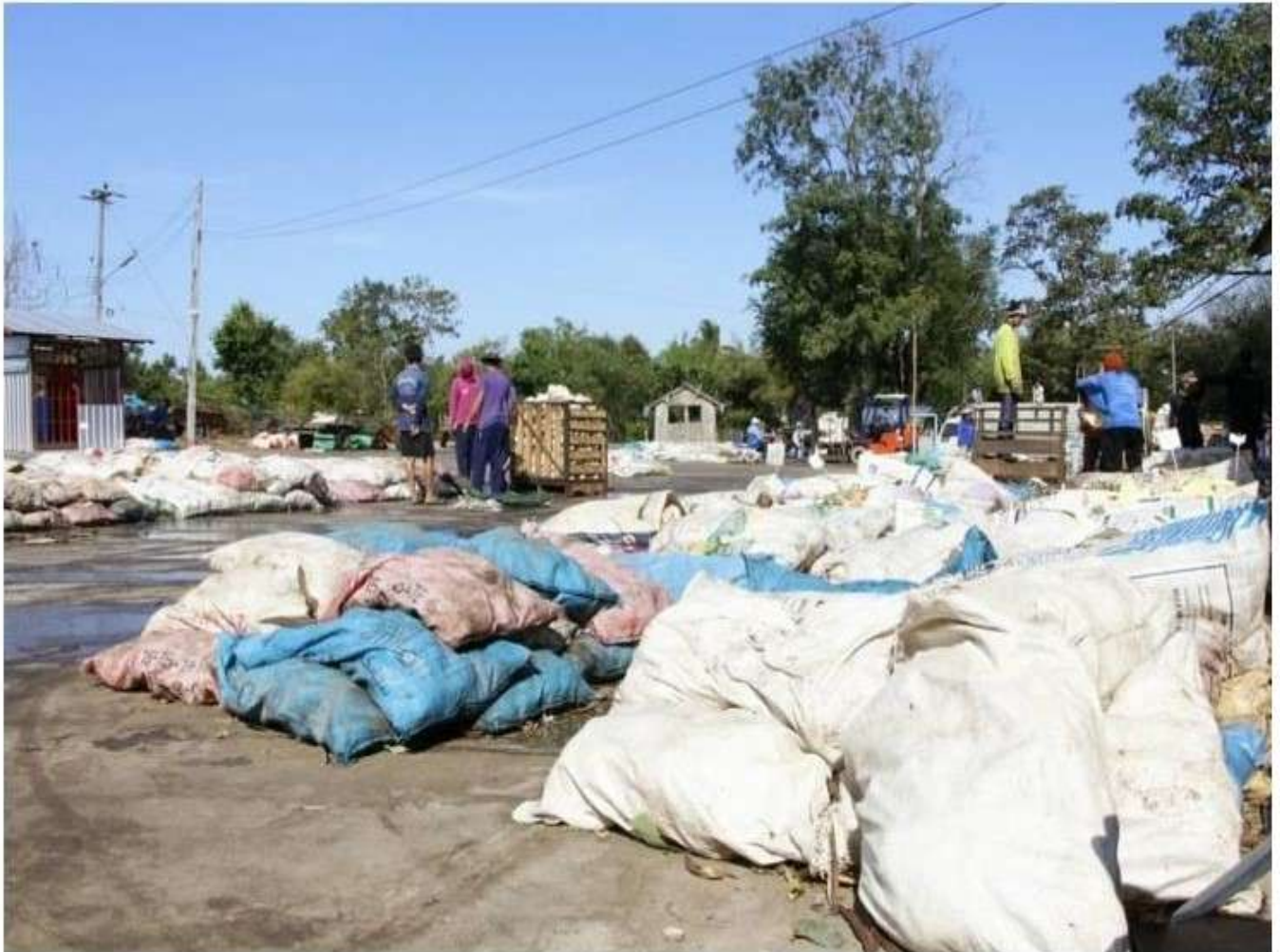
ธัญชนก ทองเพิ่ม รายงานข่าวพืชปลูก

หัวข้อข่าว: พืชปลูก กลุ่มเกษตรกรชาวสวนยาง สกย.บ้านแยง ใช้หลักสหกรณ์รวมกลุ่ม ประมูลขายยาง ได้ราคาดี