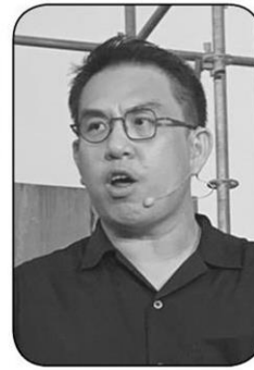
วิโรจน์ ลักขณาอติสร

ในผู้อภิปรายเพื่อไทยชักซ้อมตีปากกรอกก่อนใครเพื่อน พรรคก้าวไกลเปิดตัวผู้สมัครผู้ว่า กทม. วิโรจน์ ลักขณา อติสร ส.ส.บัญชีรายชื่อ ชันอาสาสมัครเมืองกรุง สร้าง ความผิดหวังให้เหล่ากองเชียร์ 3 นิ้ว ไม่ตบอโงะอย่างที่เคย โวผู้สมัครต้อง ใหม่ ชัด โดน แต่งานนี้ได้นักอภิปรายผลิต วากรรม ทันทีที่ประกาศตัวออกมา วิโรจน์ประกาศมีอด ใต้ทันที 'พร้อมชนเพื่อคนกรุงเทพฯ' เน้นย้ำเรื่องที่ต้องแก้ ปัญหาให้ได้ ส่วย กทม. ระบบราชการของ กทม.ที่มีจำนวน มาก ทำงานซ้ำซ้อน ปัญหานายทุนเอาเปรียบประชาชน ชู เป็น 3 เรื่องหลัก ที่ชูเป็นไฮไลต์ เน้นย้ำจะใช้ดีเอ็นเอของ พรรคก้าวไกลเข้ามาแก้ปัญหาเพื่อคน กทม. โดยจะแก้ไขปัญ หาอย่างตรงไปตรงมา พร้อมชนทุกปัญหา ประกาศพร้อม ทำงานทันที แต่ ส.ส.บัญชีรายชื่อที่วิโรจน์ยังคงคาอยู่ในสภา เจ้า ตัวบอกว่าขอทำงานในกรรมา อธิการศึกษา ให้แล้วเสร็จ ก่อน จากนั้นลาออก ส.ส.ทันที เพื่อลุยสนาม กทม.เต็มเหนี่ยว กว่านี้