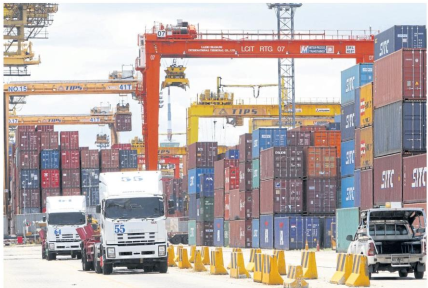
Shipment containers for export are seen at Laem Chabang port in Chon Buri province.

Mr Chaichan urged Thai exporters to speed up maximising the privileges