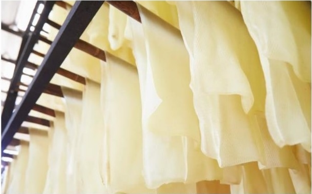
ราคายางพาราล่าสุด (การยางแห่งประเทศไทย) วันที่ 23 มิถุนายน 2565

หัวข้อข่าว: ราคายางพาราล่าสุด (การยางแห่งประเทศไทย)วันที่ 23 มิถุนายน 2565