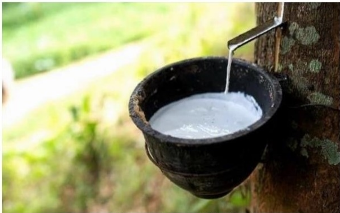
ราคายางพาราล่าสุด (การยางแห่งประเทศไทย) วันที่ 23 มิถุนายน 2565

ยางพารา ( Hevea brasiliensis ) จัดเป็นไม้ยืนต้นขนาดใหญ่ มีถิ่นกำเนิดแถบทวีปอเมริกาใต้ บริเวณลุ่มแม่น้ำอะเมซอน ประเทศบราซิล สามารถขยายพันธุ์โดยใช้เมล็ดและการติดตา จัดเป็นพืชที่ให้น้ำยางมากที่สุดและเนื้อยางมีคุณสมบัติดีกว่าชนิดอื่น สามารถให้น้ำยางได้ถึง 30 ปีและมีอายุยืนประมาณ 40 ปี ในประเทศไทยจัดได้ว่า ยางพารา