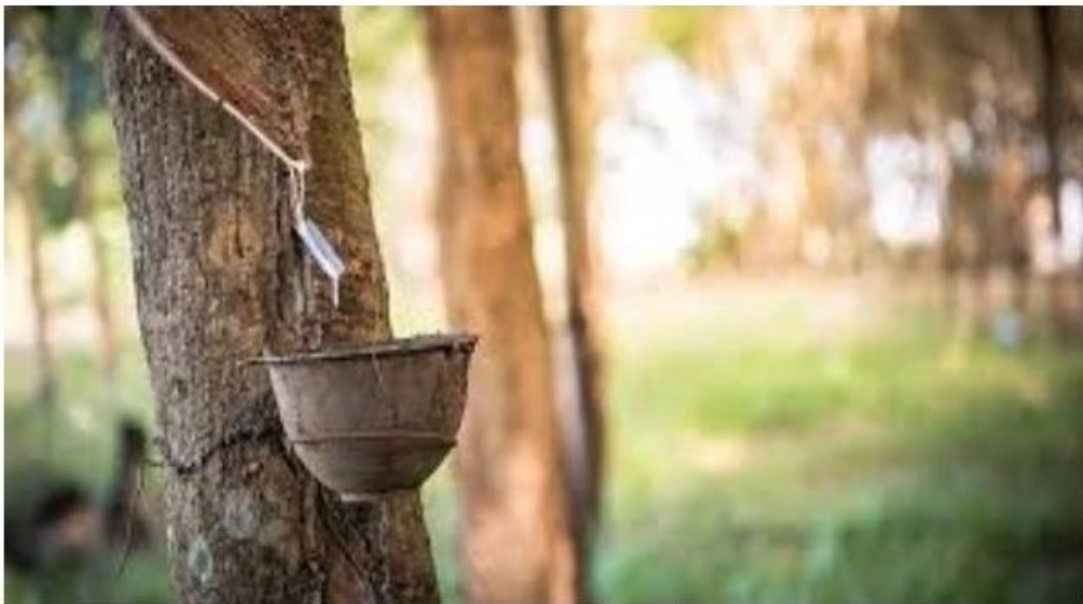
ราคายางพาราล่าสุด (การยางแห่งประเทศไทย) วันที่ 23 มิถุนายน 2565