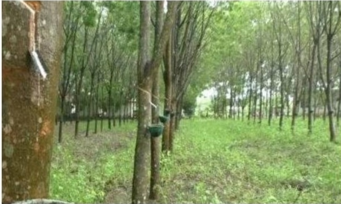
ผลผลิตยางลดฮวบ

หัวข้อข่าว: พายุกระหน่ำ สวนยางผลผลิตลดฮวบ กยท.ใช้ "แก้มลิง" เก็บยางไว้ออขาย