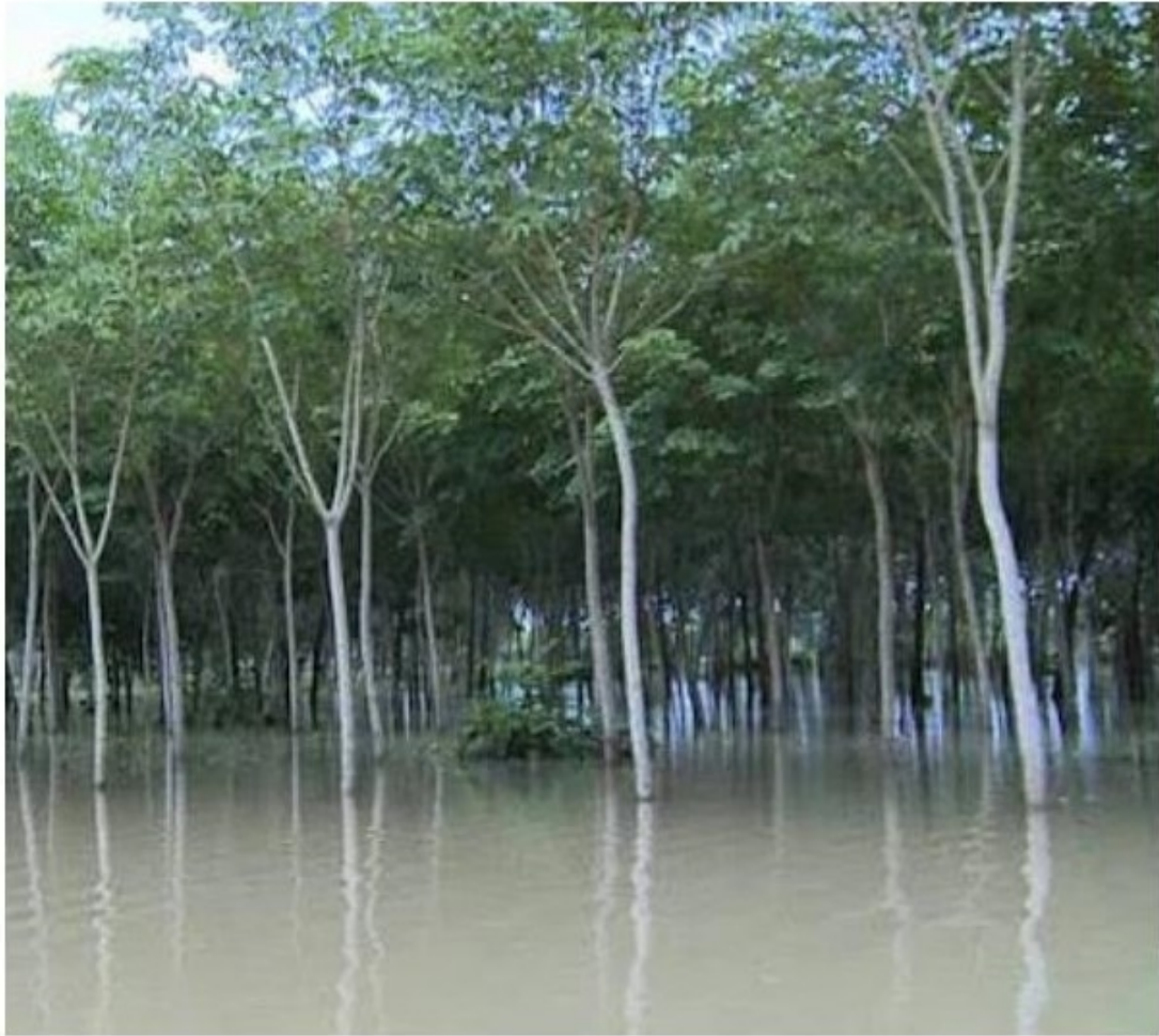
น้ำท่วมขังสวนยาง ผลผลิตลดฮวบ

นอกจากนี้กรมอุตุนิยมวิทยายังได้คาดการณ์ด้วยว่า ฝนจะตกหนักต่อเนื่องไปจนถึงปลายเดือนตุลาคม 2565 ยิ่งจะทำให้ "ปริมาณยาง" ในตลาดน้อยลง เพราะไม่สามารถกรีดยางได้ตามเป้าหมาย