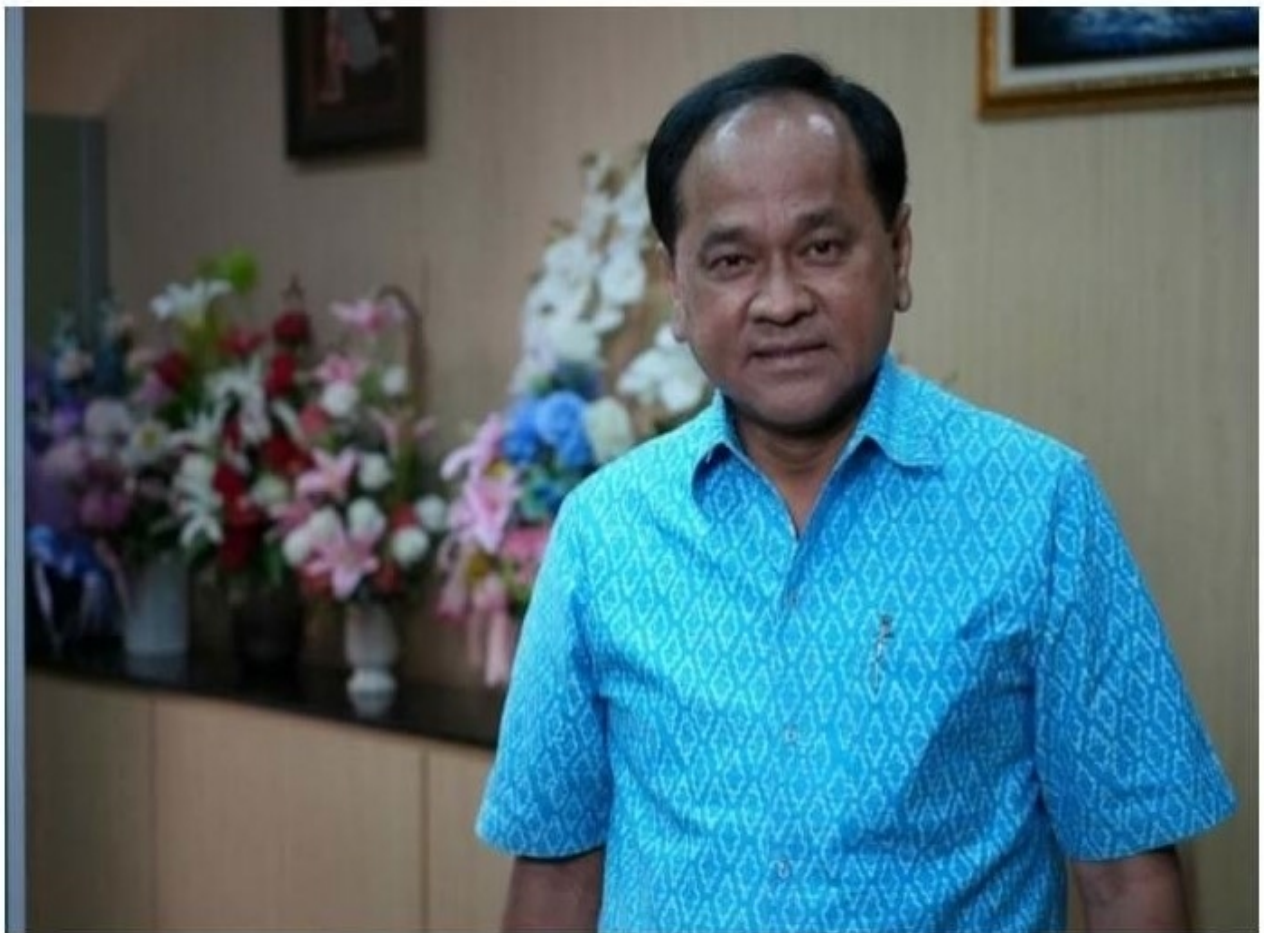
เผยแพร่ วันพฤหัสบดี 8 กันยายน พ.ศ.2565