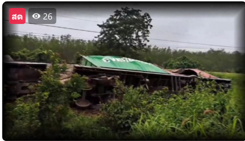
📺 Live! #รายการดีก็อดาโกปี ออกอากาศทุกวันจันทร์ - ศุกร์ เวลา 09.05 -10.00 น. ประจำวันที่ 15/12/65 สถานีโทรทัศน์แห่งประเทศไทย จ.ยะลา 49 นาที ago