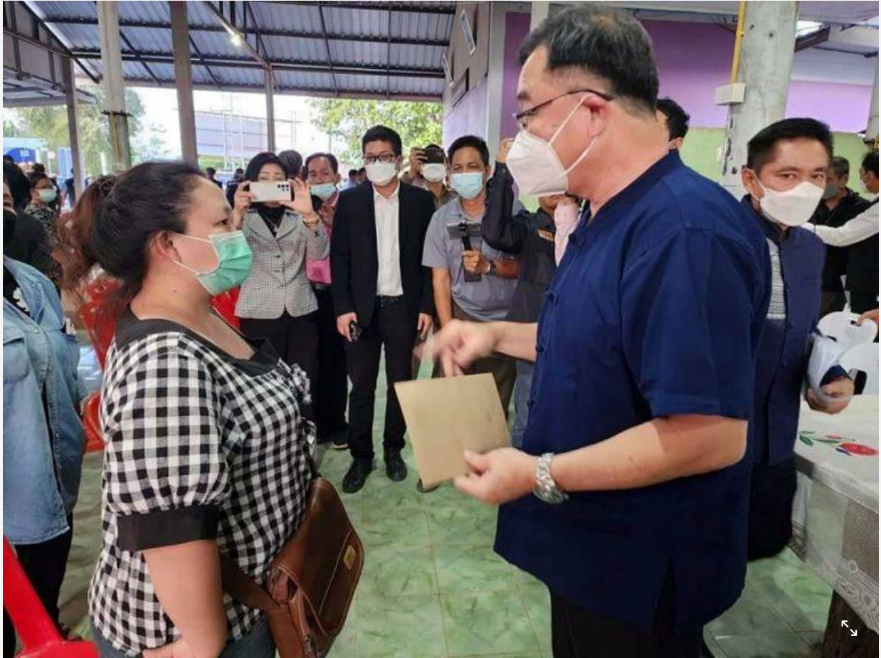
โฆษณา - อ่านบทความต่อต้านล่าง