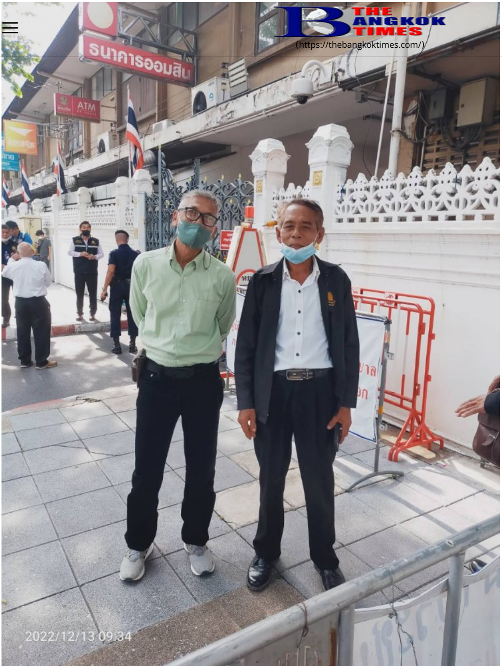
นอกนั้นยังมีเรื่องโครงการชะลอวาง และ ฯลฯ ซึ่งเป็นของกลุ่มยางอีกหลายกลุ่มเพื่อผนึกเข้าร่วมกันเป็นประเด็นในการแก้ไขปัญหายางพารา.