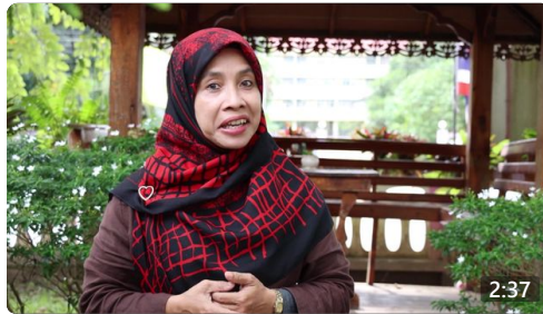
📺 ว้าวสลาดัน 15 ธ.ค. 65 ตอน สถานธนานุนบาล เทศบาลนครยะลา มอมของขวัญปีใหม่ #ว้าวสลาดัน... สถานีโทรทัศน์แห่งประเทศไทย จ.ยะลา ดู 83 ครั้ง · 1 ชม. ago