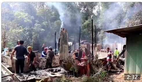
📺 เกิดเหตุเพลิงไหม้ร้านขายของชำ ด.ดาเนาะแมเราะ อ.เบตง จ.ยะลา ลามบ้านข้างเคียง เสียหายหมดทั้ง... สถานีโทรทัศน์แห่งประเทศไทย จ.ยะลา ดู 405 ครั้ง · 2 ชม. ago