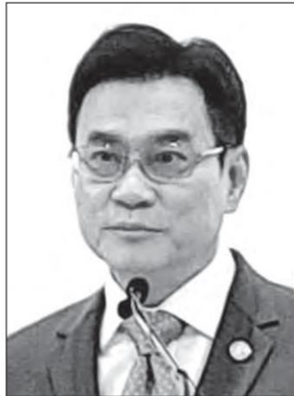
จรินทร์ ลักษณะวิศิษฎ์

ต้องยอมรับว่าพรรคประชาธิปัตย์ในยามนี้มีแต่ข่าวที่ไม่ดีผลบวกออกมาเลย ไม่เรื่อง “เลือดไหลออก” หรือ ส.ส.ย้ายพรรคเป็นรายวันแล้ว ยังมีเรื่องปัญหาความขัดแย้งภายในที่ยังไม่จบไม่สิ้นเสียที เพราะหากจะบอกว่าปัญหาความแตกแยก ก็เกิดขึ้นมาจากการเลือกตั้งหัวหน้าพรรคคนใหม่ที่แม้ว่า นายจรินทร์ ลักษณะวิศิษฎ์ เป็นหัวหน้าพรรค และ นายเฉลิมชัย ศรีอ่อน เป็นเลขาธิการพรรค พร้อมกับคณะกรรมการบริหารพรรคชุดใหม่ แต่ผ่านมานานหลายปี อย่างน้อยก็ร่วมสามปีมาแล้ว ปัญหาภายในก็ยังไม่จบ เกิดการปะทุขึ้นมาเป็นครั้งคราว