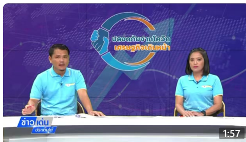
📺 เทศบาลเมืองสุโขทัย-ลก เตรียมเปิดประตูระบายน้ำ สถานีโทรทัศน์แห่งประเทศไทย จ.ยะลา ดู 868 ครั้ง · 14 ชม. ago