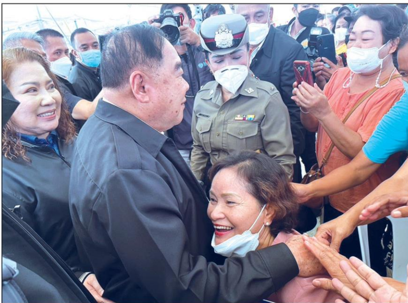
▲ ต้อนรับอบอุ่น : พล.อ.ประวิตร วงษ์สุวรรณ รองนายกรัฐมนตรีและหัวหน้าพรรคพลังประชารัฐ เดินทางลงพื้นที่ จ.สมุทรสงคราม และ สมุทรสาคร เพื่อติดตามการก่อสร้างระบบระบายน้ำหลัก ระบบป้องกันน้ำท่วม และการพัฒนาแหล่งน้ำที่สำคัญในพื้นที่ โดยได้พบปะประชาชนที่มารอต้อนรับและเข้ามากอดอย่างอบอุ่น

จดหมายเปิดใจ "บักป้อม" เผยเหตุ ดัน "ประยุทธ์" นั่งนายกฯ ปี'62 เพราะเจ้าตัวปรรธนา รับมติกรม.หลายเรื่องมีทั้งเห็นด้วย-ไม่เห็นด้วย ย้ำ 3ป.Forever แต่ไม่สามารถบรรยายความรู้สึกได้ หลังแยกไป รทสช.ทำได้แค่นิดี ลั่นทิ้งลูกพรรคไม่ได้ รับ จม.เปิดใจของจริง ย้ำ 3ป.Forever ล้นสัมพันธ์ "บักตู" ยังคืออยู่ บอกไม่รู้เรื่อง สว.ชงแก้รธน.วาระ 8 ปี "บักตู" ยังไม่ได้อ่าน จม.เปิดใจ "พีป้อม" ยันรักกัน ไม่ได้มีปัญหา ย้ำคบกันมา 40-50 ปี ร่วมเป็นร่วมตาย สนามรบ คู่ยกกันเองได้ ▶ ต่อ : บักป้อม - หน้า 9