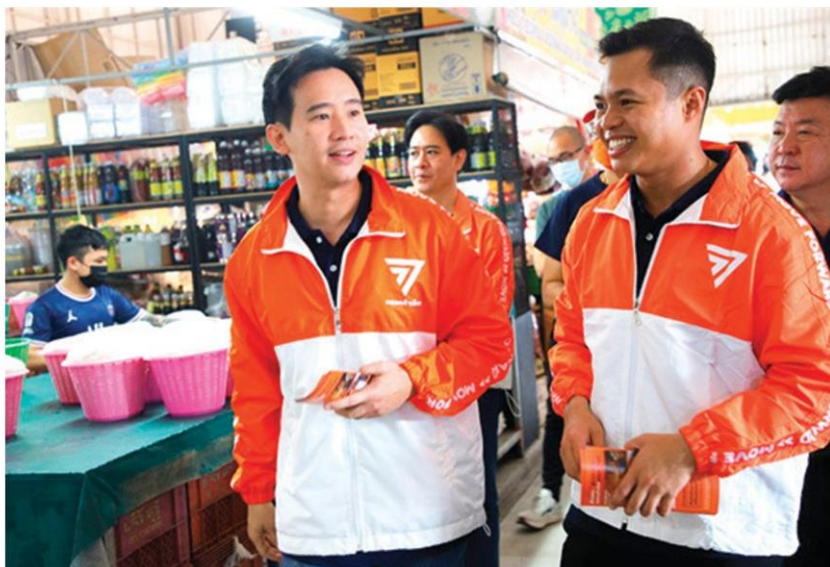
ลุยฝั่งธน - นายพิธา ลิ้มเจริญรัตน์ หัวหน้าพรรคก้าวไกล นำทีมว่าที่ผู้สมัคร ส.ส.พรรคก้าวไกลในฝั่งธนบุรีของกรุงเทพมหานคร ร่วมเดินสายพบปะประชาชนเพื่อประชาสัมพันธ์ตัวผู้สมัครทั้ง 9 คนใน 10 เขต แสดงความพร้อมในการสู้ศึกเลือกตั้งที่จะเกิดขึ้นในปีนี้ เมื่อวันที่ 15 มกราคม

พท.บุกอุดรปลูกกาแน่นๆ ขอ280อัพสกัดนั่งร้านสว. พิธาลุยหาเสียงยึดฝั่งธน ป้อมทัวร์พะเยา'ผู้กอง'รับ สุวัจน์แย้มนโยบายแก้ศก. 'อึ้งอึ้ง'คึกบุกอุดรฯ ลั่นพร้อมเป็นแคนดิเดตชิงนายกฯ ชูเป็นจุดขายแลนดส์ไลต์ ปลูกชาวอีสานกาแน่นๆ ขอ 280 อัพสกัด รทสช.-นั่งร้าน สว. ยันไม่จับขั้ว ฝ่ายตรงข้าม ปชต. 'พิธา'ลุยหาเสียงประกาศยึดฝั่งธน 'สุวัจน์'โชว์นโยบายแก้ ศก. 'บิ๊กป้อม'ขึ้นพะเยา 'ธรรมนัส'ต้อนรับ (อ่านต่อหน้า 12)