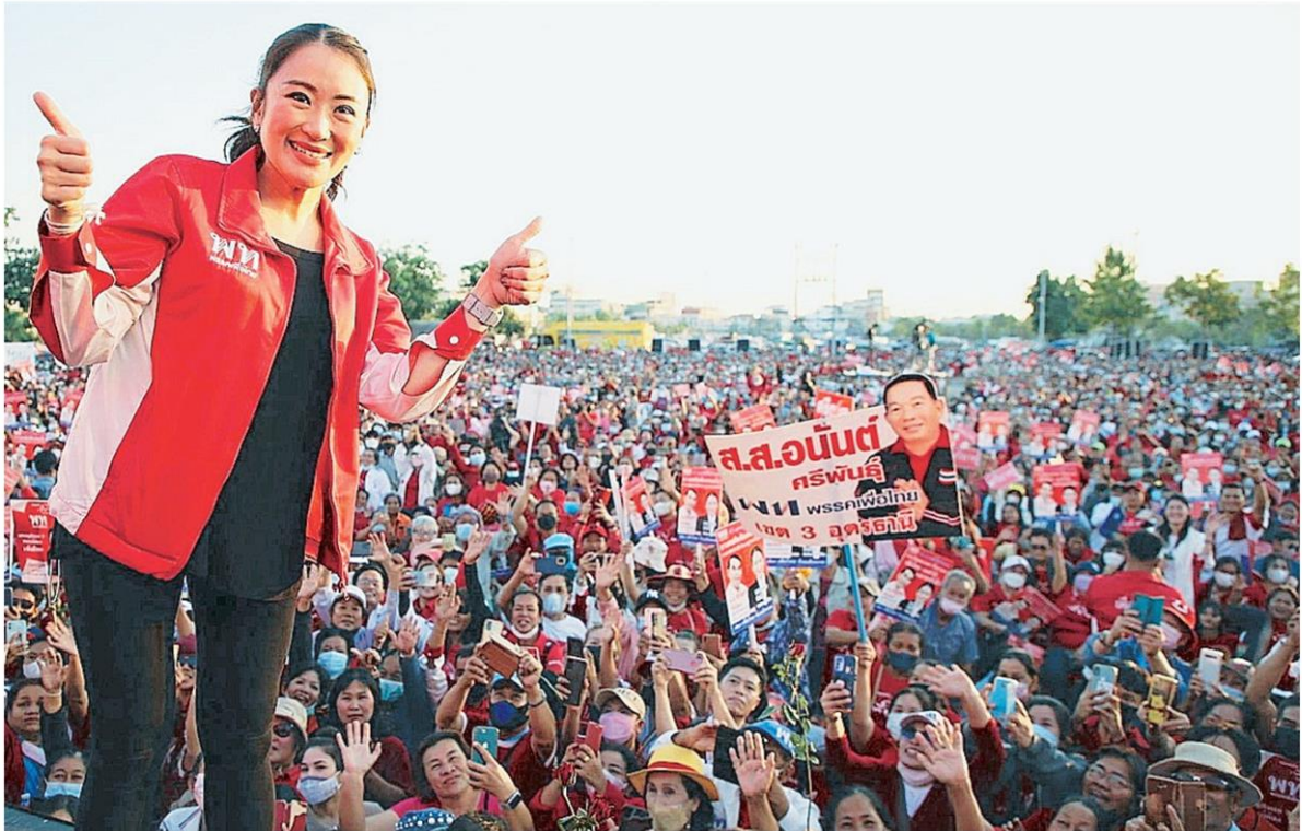
พร้อมแล้ว น.ส.แพทองธาร ชินวัตร "อุ้งอึ้ง" หัวหน้าครอบครัวเพื่อไทย ถ่ายภาพกับพี่น้องประชาชนชาวอุดรธานีขณะขึ้นเวทีปราศรัยใหญ่ "ครอบครัวเพื่อไทย: อีสานยามไฉ่ เพื่อไทยทอนัน" ที่ทุ่งศรีเมือง อ.เมืองอุดรธานี ประกาศพร้อมแล้วที่จะเป็นแคนดิเดตนายกฯ เพื่อเป้าหมายแลนด์สไลด์.

หัวข้อข่าว: 'อุ้มท้อง'ปราศรัย'อุ้งอึ้ง'ลั่นแคนดิเดตนายกฯ