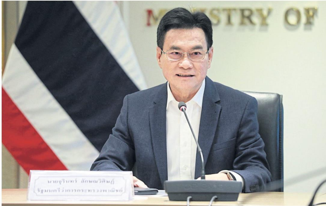
Mr Jurin will act as Thailand's representative to notify the EU of the country's readiness to pursue an FTA.