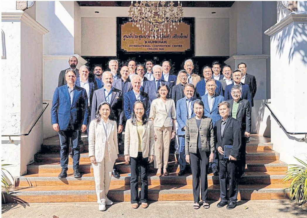
Business leaders in attendance at the 8th Italian-Thai Business Forum which took place on Jan 12 in Chiang Mai.

Business leaders have been participating in trade negotiations at the eighth edition of the Italian-Thai business forum.