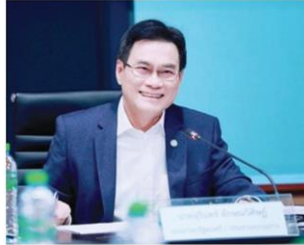
'จรินทร์'ลุยบรัสเซลส์ เจรจา FTA ไทย-อียูต้นส่งออก