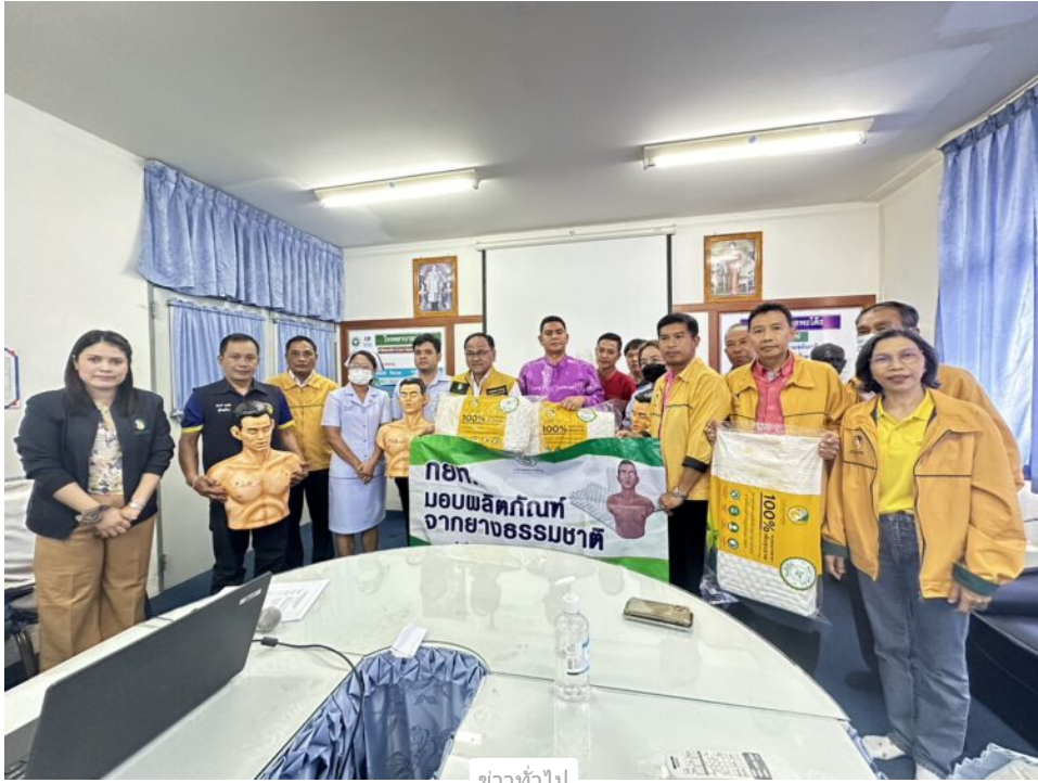
ชาวทั่วไป