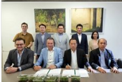
ปฏิวัติวงการยาง!! กยท. ร่วมเบลเยียม รุกวิจัยเพาะเลี้ยงเนื้อเยื่อ เสริมคุณภาพพันธุ์ยาง เพิ่มรายได้ชาวสวนยาง