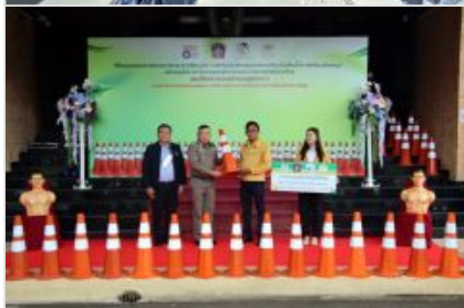
กยท. เดินหน้าส่งเสริมนวัตกรรมยางเพื่อประโยชน์สังคม มอบกรวยยางจรรยา แก่ ตำรวจภูธรภาค 5