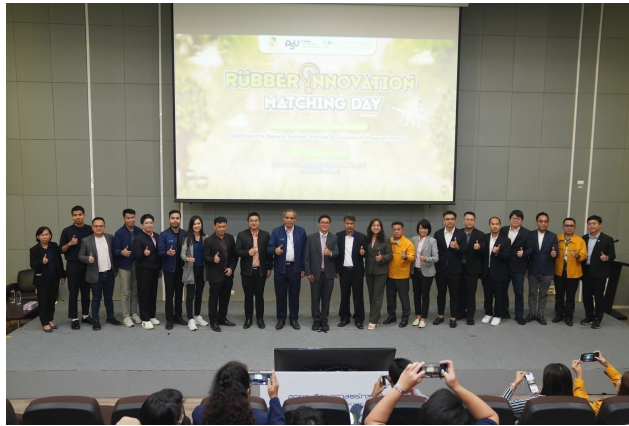
บันทึกโดย : Admin วันที่ : 27 ก.ย. 2566 เวลา : 20:11:23