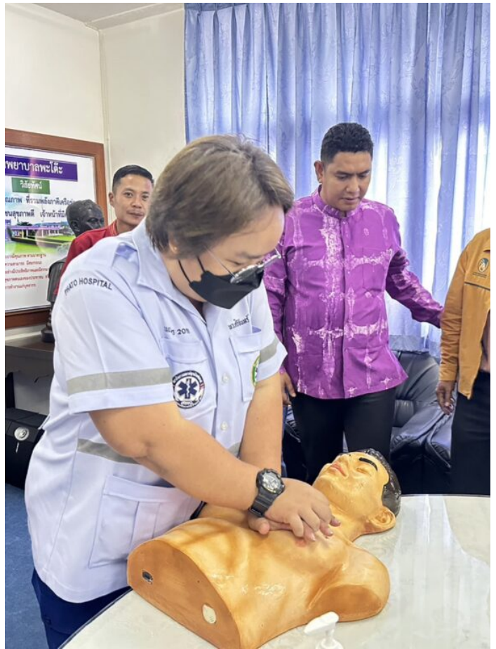
📁 ข่าวทั่วไป, ข่าวเกษตร