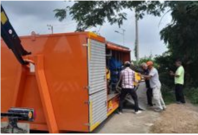
ศูนย์ ปภ. เขต 2 สุพรรณบุรี สนับสนุนเครื่องสูบน้ำระยะไกลพร้อมเจ้าหน้าที่ให้ความช่วยเหลือพื้นที่ท่วมน้ำข้างอ่างทอง

ชาวบ้านในพื้นที่บอกว่า โรงงานรับซื้อของเก่าดังกล่าว ซึ่งเป็นโรงงานที่นออกจากจะรับซื้อของเก่าแล้ว ยังมีการรับซื้อ ประเภทสารเคมีมาฝังกลบด้วย ที่ผ่านกระทบกระทั่งกับชาวบ้านมาโดยตลอด และกระทบสิ่งแวดล้อม ในเรื่องของ กลิ่นและน้ำเสีย กระทบกระทั่งปัจจุบันได้ปิดกิจการไปแล้ว ซึ่ง 2 วันที่ผ่านมา เกิดฝนตกหนักในพื้นที่ ชาวบ้านสังเกตเห็นบ่อ บำบัดดังกล่าว พบบ่อบำบัดมีน้ำเต็มบ่อพบร่องรอยน้ำล้นเหนือคันบ่อดินไหลเป็นทาง จึงแจ้งหน่วยงานที่เกี่ยวข้อง และ อปท.ในพื้นที่มาตรวจสอบ และได้นำรถแบคโฮมาเสริมคันดิน ก่อนที่จะพบว่าน้ำในบ่อล้นจนคันดินรับไม่ไหว พังทลายลงมาดังกล่าว น้ำเสียไหลผ่านหมู่บ้าน โรงเรียนที่อยู่ติดโรงงาน เข้าสวนยางพารา ผ่านหนองน้ำของชุมชน และบ่อเลี้ยงกบของชาวบ้านในพื้นที่ได้รับความเสียหาย ก่อนจะไหลลงคลองสาธารณะลงแม่น้ำระยองต่อไป ทั้งนี้ ชาวบ้านในพื้นที่อยากให้หน่วยงานที่เกี่ยวข้อง ได้มีมาตรการรองรับที่ชัดเจน ว่าจะเกิดเหตุการณ์ลักษณะดังกล่าว ซ้ำอีก แล้วยังต้องมารับเคราะห์กรรมจากน้ำเสียปนเปื้อนสารเคมีดังกล่าวซ้ำซากอีกด้วย