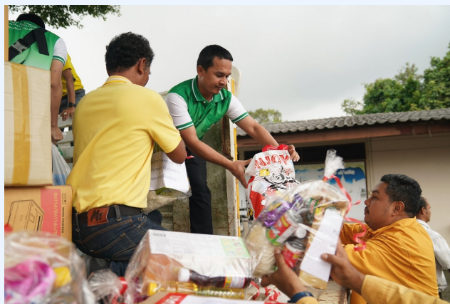
บันทึกโดย : Admin วันที่ : 19 ม.ค. 2567 เวลา : 17:45:17

รองผู้ว่าการด้านธุรกิจ กล่าวเพิ่มว่า สำหรับเกษตรกรฯ ที่ขึ้นทะเบียนกับ กยท. และสวนยางได้รับความเสียหายจากอุทกภัย (ต้นยางเสียหายไม่สามารถเติบโตหรือเก็บเกี่ยวผลผลิตได้ ไม่น้อยกว่า 20 ต้นในแปลงเดียวกัน) สามารถขอรับสวัสดิการช่วยเหลือกรณีสวนยางประสบภัย รายละ 3,000 บาท โดยสามารถแจ้งรับความช่วยเหลือจาก กยท. ในพื้นที่ภายใน 30 วัน นับจากวันที่เหตุภัยพิบัติสิ้นสุดลง และยื่นขอรับเงินกู้ยืมฯ รายละไม่เกิน 50,000 บาท ทั้งนี้ หลังจากนำลดกลับสู่สภาวะปกติ เจ้าหน้าที่ของ กยท. ได้เร่งลงพื้นที่เพื่อตรวจสอบสภาพสวนให้เกษตรกรที่แจ้งขอรับความช่วยเหลือ ควบคู่กับการถ่ายทอดความรู้ให้เกษตรกรฯ ทราบถึงวิธีการดูแลสวนยางหลังน้ำท่วม และการประกอบอาชีพเสริม เพื่อเป็นทางเลือกในการเพิ่มรายทดแทนให้ชาวสวนยางต่อไป