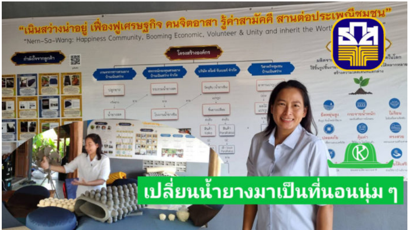
ธ.ก.ส. หนุนวิสาหกิจชุมชนบ้านเนินสว่าง แปรรูปน้ำยางเป็นผลิตภัณฑ์ส่งขายทั้งในและต่างประเทศ