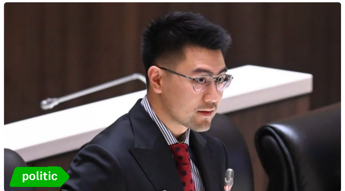
"สส.อัครแสนคีรี" จี กรมชลฯ เร่งบรรจุโครงการอ่างเก็บน้ำช่อง