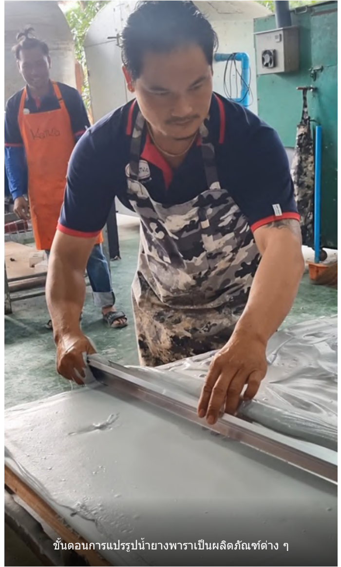
ขั้นตอนการแปรรูปน้ำยางพาราเป็นผลิตภัณฑ์ต่าง ๆ

“เราเริ่มจากการเป็นวิสาหกิจชุมชนต่อยอดมาเป็นสหกรณ์ จากนั้นเราจึงจดทะเบียนเป็นบริษัทชื่อสไมล์รับเบอร์หรือยาง ยิ้ม เพื่อทำการส่งออกในแบรนด์พารารักษาและไคกา เป็นที่นึ่งนุ่ม ๆ และที่นอนนิ่ม ๆ ของดีมีคุณภาพจากบ้านเนินสว่าง ราคาไม่แพงเหมาะสมกับคุณภาพสินค้าที่เราสร้างสรรค์มาอย่างดี”