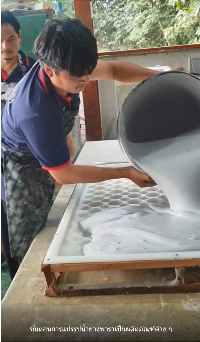
ขั้นตอนการแปรรูปน้ำยางพาราเป็นผลิตภัณฑ์ต่าง ๆ