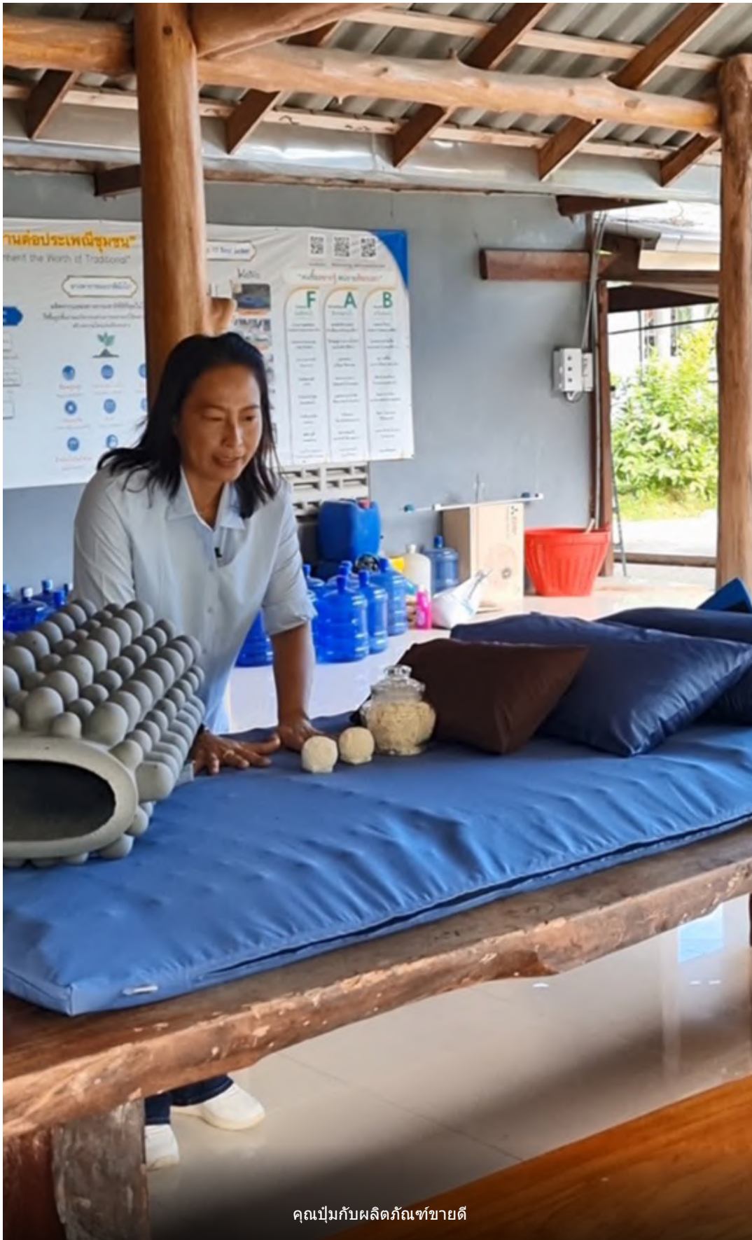
คุณเป็มกับผลิตภัณฑ์ขางดี

คุณเป็มกล่าวด้วยความภาคภูมิใจ ก่อนจะพา ลุงพร เกษตรก้าวหน้าไกล เดินไปเยี่ยมชมโรงงานให้เห็น กระบวนการผลิตต่างๆ เครื่องที่นำมาใช้ก็เป็นเครื่องมือง่ายๆ ดัดแปลงมาจากเครื่องทำขนม เมื่อนำนายางพารามาใส่หม้อแปรรูปแล้วก็นำมาเข้าโรงนึ่งอบขึ้นรูป แล้วนำออกมาทำความสะอาด มาซ้กล้างอย่างเรียบร้อย ป้องกันสารเคมีกำจัดไวรัสและเชื้อ