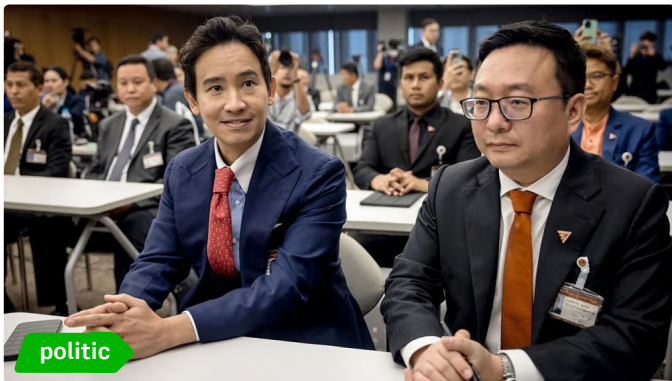
ลัมล่างปกครอง แก่ "112" เชือดถ้าวไกล ศาลรัฐธรรมนูญชี้ชัด