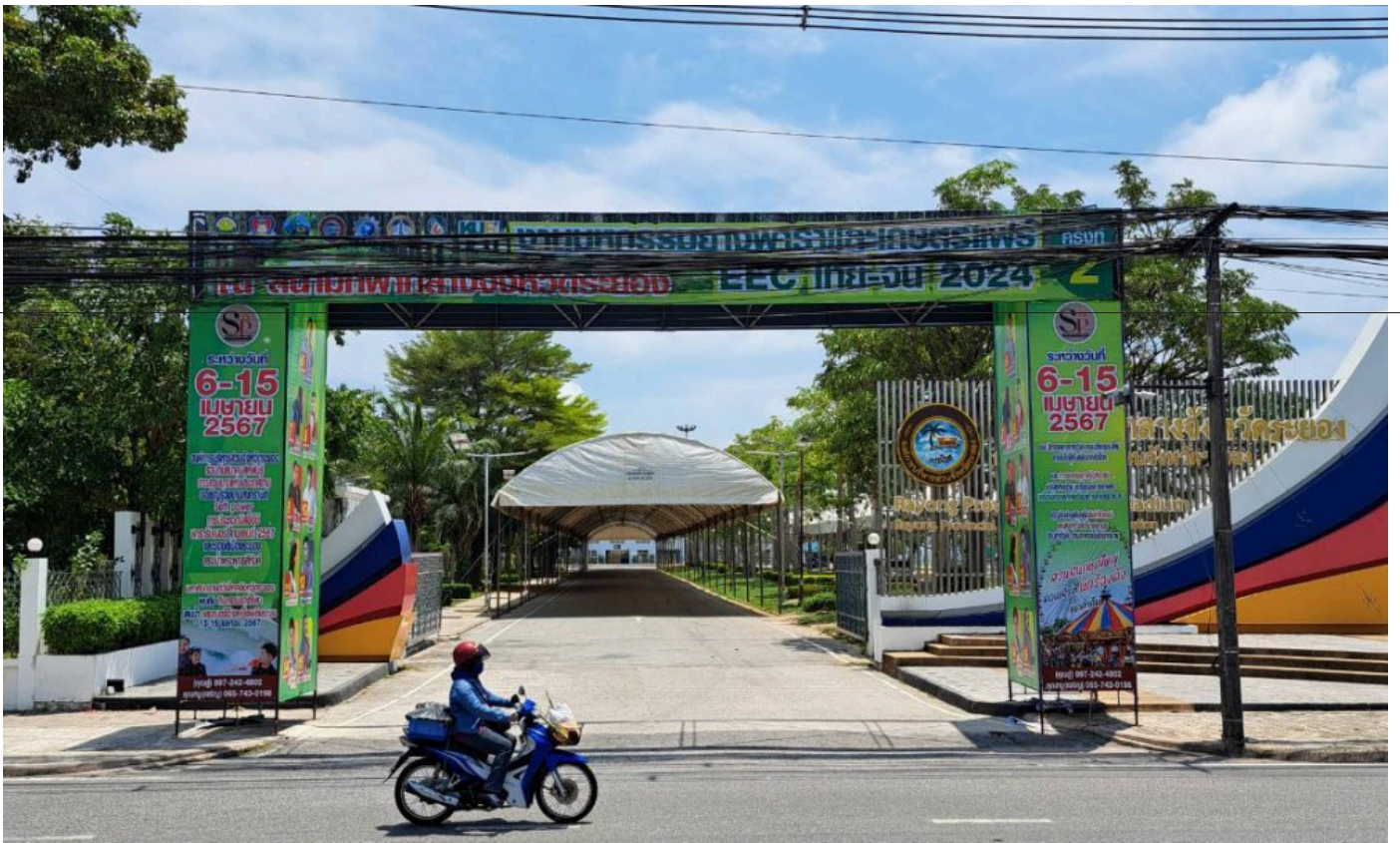
สถานที่เตรียมจัดงาน

ขณะเดียวกัน ยังได้ทุนการศึกษาในประเทศจากสถาบันการจัดการปัญญาภิวัฒน์ (แจ้งวัฒนะ) ในคณะเกษตรนวัตและการจัดการ สาขาวัตกรรมการจัดการเกษตรด้วย ผู้สนใจสอบถามรายละเอียดได้ที่ 080 4242299