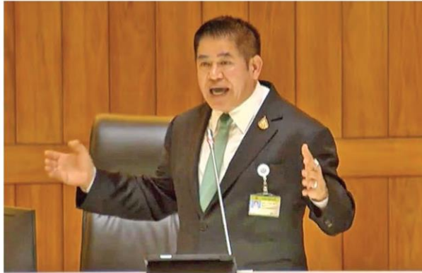
ร.อ.ธรรมนัส พรหมเผ่า รมว.เกษตรและสหกรณ์

หัวข้อข่าว: "ธรรมนัส" ยันนโยบายยางมาถูกทาง