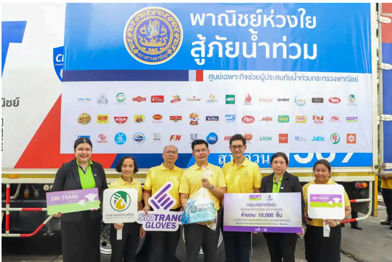
Date: 24/09/2024 Author: Siwarote S.