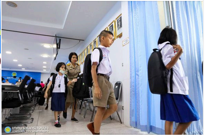
เทศบาลนครสงขลา" รับมอบกระเป๋าผลิตภัณฑท์จากย จากการยางแห่งประเทศไทยเขตภาคใต้ตอนล่าง