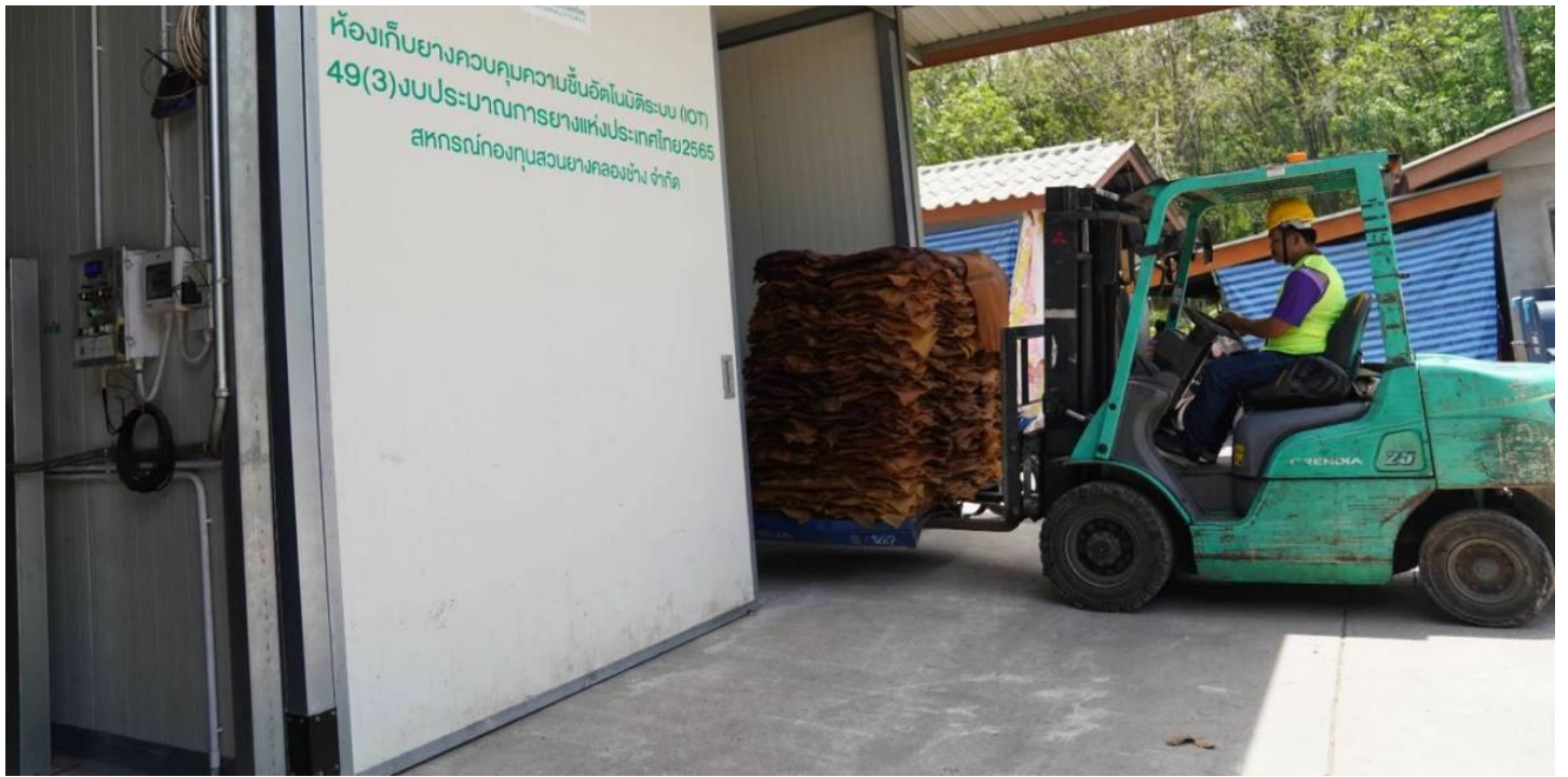
โฆษณา - อ่านบทความต่อต้านล่าง