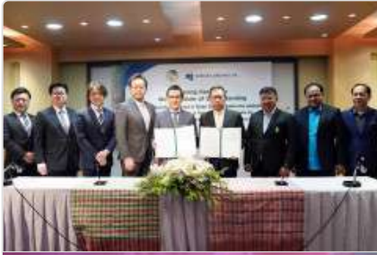
กยท. MOU บ.เอกชนญี่ปุ่น มุ่งวิจัยเมล็ดยาง เพิ่มมูลค่าสู่พลังงานสีเขียว