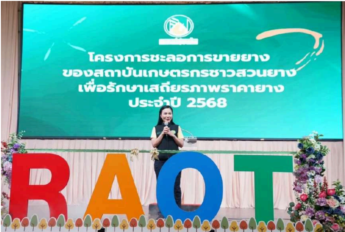
ศ.ดร.นฤมล ภิญโญสินวัฒน์

"การ Kick Off โครงการชะลอการขยายยาง ประจำปี 2568 ในครั้งนี้ เป็นการเผยแพร่กิจกรรมที่ กยท. ได้ดำเนินการอย่างเป็นรูปธรรม สร้างการรับรู้และความเข้าใจให้เกษตรกรชาวสวนยาง และสถาบันเกษตรกรชาวสวนยาง ให้สนใจสมัครเข้าร่วมโครงการฯ เพิ่มมากขึ้น เกิดการส่งเสริมและสนับสนุนให้เกิดการมีส่วนร่วมในการจัดการผลผลิตยาง เพื่อการสร้างเสถียรภาพด้านราคาในระบบตลาดได้อย่างยั่งยืน" รมว.เกษตรฯ กล่าวย่อ