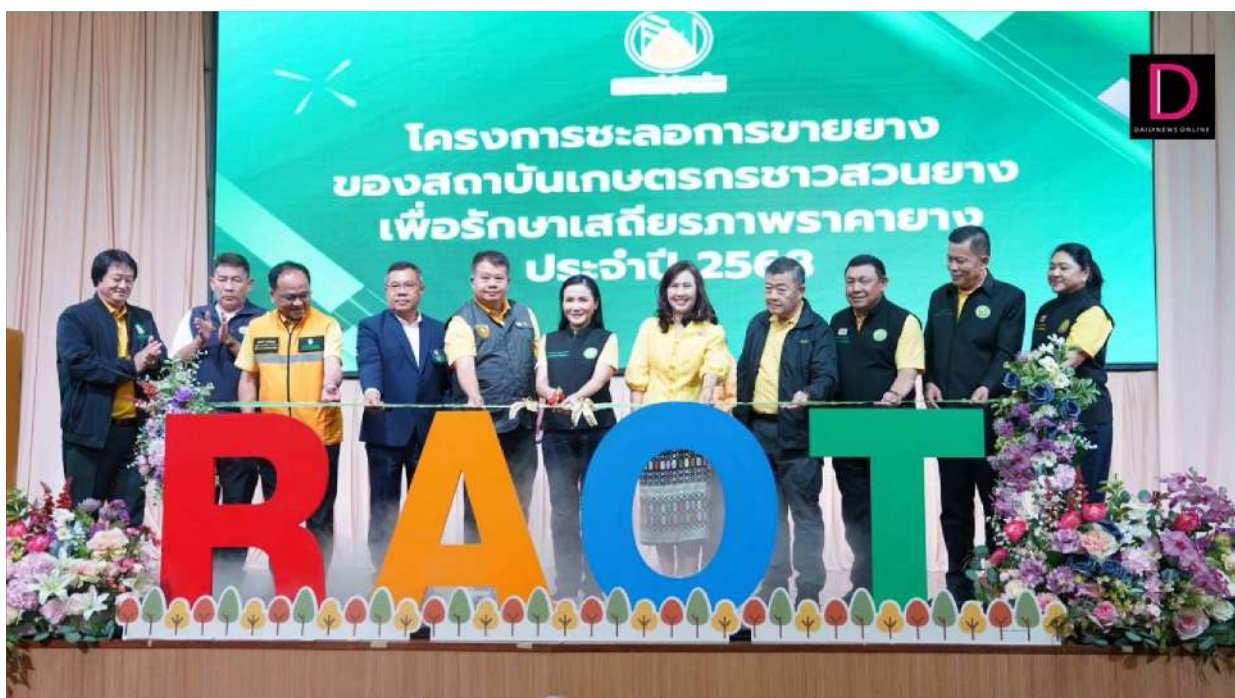
กยท.เดิหน้า"โครงการชะลอวาง" หวังเพิ่มสภาพคล่อง สร้างรายได้ชาวสวนยาง พร้อมดูดซับ - ปรับสมดุลปริมาณยางในตลาด สู่เสถียรภาพด้านราคา