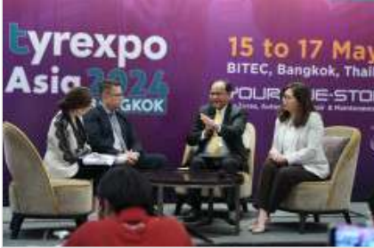
กยท. ลุยงานมหกรรม "TyreXpo Asia 2024" โชว์ศักยภาพยางไทยรองรับ EUDR