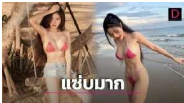
( https://www.dailynews.co.th/news/4094886/ )