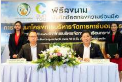
กยท. MOU อบก. บริหารจัดการคาร์บอนเครดิตในสวนยาง เพิ่มรายได้เสริมเกษตรกร