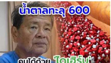
น้ำตาลสูงปรี๊ดเสี่ยงเลือดเป็นกรด แก้ด้วยสารสกัดสมุนไพร 11 ชนิด!

■ ผอ.สำนักงาน กคต. นำคณะสังเกตการณ์การส่งมอบบัตรเลือกตั้งและวัสดุอุปกรณ์ การเลือกตั้งนายก อบจ.อุบลราชธานี ( https://www.banmuang.co.th/news/politic/41125 ) 16:44 น.