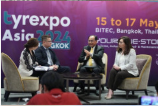
กยท. ลุยงานมหกรรม “TyreXpo Asia 2024” โชว์ศักยภาพยางไทยรองรับ EUDR