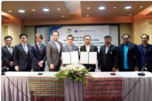
กยท. MOU บ.เอกชนญี่ปุ่น มุ่งวิจัยเมล็ดยาง เพิ่มมูลค่าสู่พลังงานสีเขียว