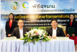
กยท. MOU อบก. บริหารจัดการคาร์บอนเครดิตในสวนยาง เพิ่มรายได้เสริมเกษตรกร