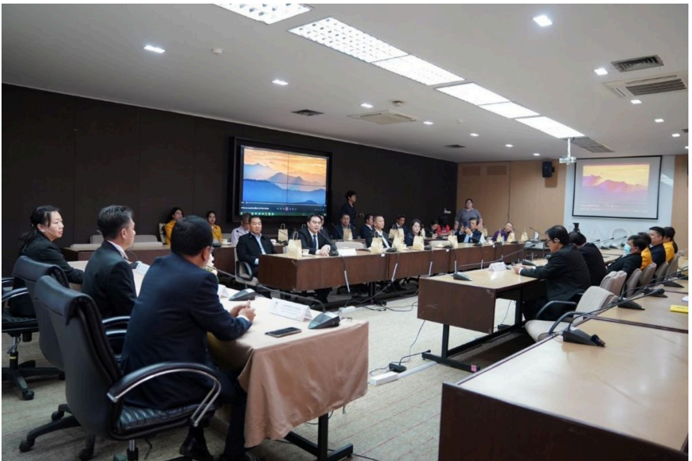
ทีมข่าวประชาสัมพันธ์ กยท.