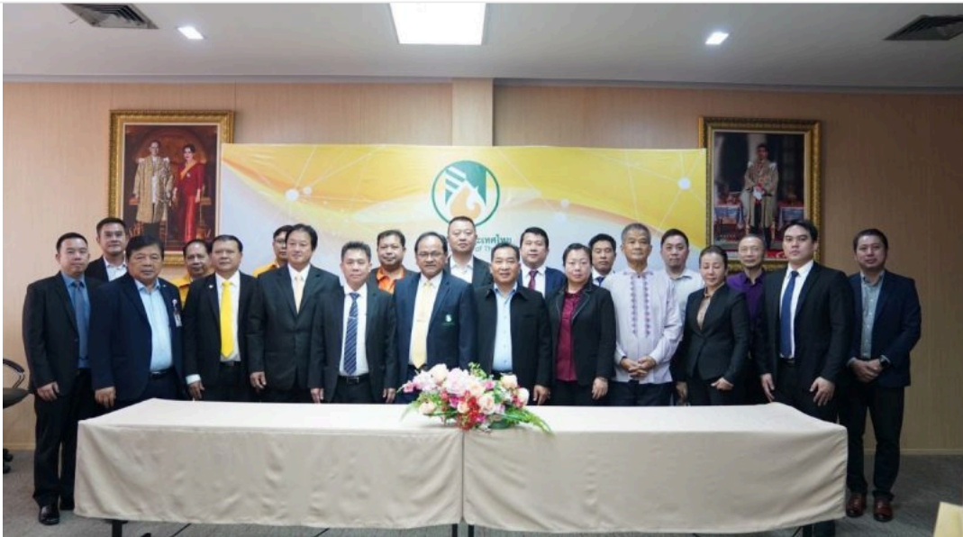
ข่าวการเกษตร