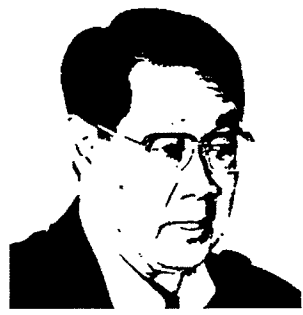
• ม.ร.ว.ปรีดิยาธร เทวกุล

องค์กรอิสระทั้งหลายต้องให้ความร่วมมือ และ “เสียสละ” เเนกเช่นท่านผู้นำจ้อเกือบทุกคำวันศุกร์หน้าจ้อทีวี..... ท่องเที่ยวไทยมีปัญหา(อีก)จนได้...กับคดีฆาตกรรม 2 หนุ่มสาวชาวอังกฤษที่เกาะเต่า...ณ บัดนี้ตำรวจยังไม่ได้ตัวฆาตกรมาลงโทษ!!! พุดถึงเรื่องการโปรโมตท่องเที่ยวไทยครั้งใด “นื่องทอง” อดห่วงไม่ได้กับการ