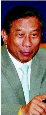
พล.อ.ฉัตรชัย สาริกัลยะ