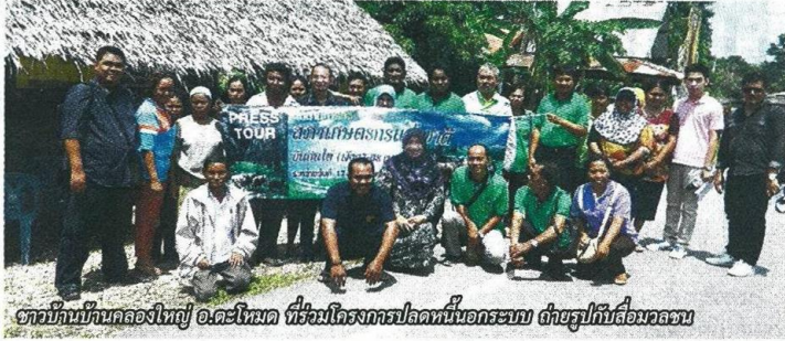
ชาวบ้านที่กินคลองใหญ่ อ.ตะโหมด ที่ร่วมโครงการปลดหนี้ในระบบ ด้วยรูปกับสื่อมวลชน

ไม่มีปัญญาจ่าย สุดท้ายเข้าพึ่งศูนย์ดำรงธรรม ชัยนาท ช่วยไกล่เกลี่ยเหลือ 1.5 แสนบาท นี้แค่เพียงดอกเบี้ยร้อยละ 3 ต่อเดือน แต่พื้นที่อื่นที่มีนายทุนจากต่างถิ่นคิดดอกเบี้ยร้อยละ 20-400 ต่อเดือน ที่เหตร้ายมีการคิดดอกเบี้ยร้อยละ 20 ต่อวันอีกด้วย อย่างที่บ้านคลองใหญ่ ต.คลองใหญ่ อ.ตะโหมด จ.พัทลุง มีนายทุนต่างถิ่นช่วงแรกปล่อยเงินกู้ในระบบดอกเบี้ยร้อยละ 20 ต่อเดือน พอชาวบ้านไม่มีเงินจ่ายดอกเบี้ย ก็ต้องไปกู้รายอื่นร้อยละ 20 ต่อวัน เพื่อไปจ่ายดอกเบี้ยให้เจ้าหนี้รายแรก