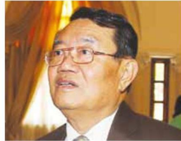
อำนาจ ปะติเส

นอกจากนี้รัฐบาลได้มีการเจรจากับรัฐบาลจีนให้ผ่อนปรนเงื่อนไขการนำเข้าผลิตภัณฑ์