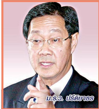
น.ร.ว. ปรีดิยาธร

ความจริงรัฐบาลรู้ซึ่งปัญหานี้ดี จึงตั้ง "นายอานวย ปะติเส" มานั่งเก้าอี้รมช.เกษตรฯ มีภารกิจพิเศษ แก้ปัญหาราคาคาผลผลิตทางการเกษตรโดยเฉพาะ