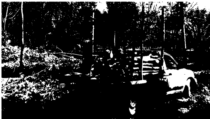
หมดหนทาง - นายจอน หัวยแก้ว ชาวสวนยางต.บ้านล้อง อ.เวียงสระ จ.สุราษฎร์ธานี ต้องโค่นต้นยางที่เพิ่งกรี๊ดได้ปีเดียวขายทิ้ง เพื่อนำเงินมาเป็นค่าใช้จ่ายในแต่ละวัน รวมทั้งเป็นค่าผ่อนรถที่ค้างชำระมาหลายเดือนจนไฟแนนซ์จะยึดรถยนต์แล้ว เนื่องจากรายได้หายไปกว่า 60%