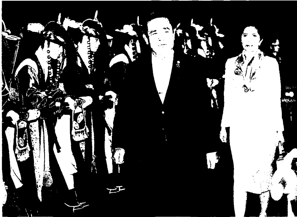
▲ เวทีผู้นำ พล.อ.ประยุทธ์ จันทร์โอชา นายกษ และหัวหน้า คสช. พร้อมนางนราพร จันทร์โอชา ภริยา เดินทางตรวจแถวทหารกองเกียรติยศ ที่มารอรับ ณ สถานที่พาศาศกิมแซ นครปูซาน สาธารณรัฐเกาหลี เพื่อเข้าร่วมประชุมสุดยอดอาเซียน-สาธารณรัฐเกาหลี วันที่ 10-12 ธ.ค.

วันที่ 12 ธันวาคม 2557 น. 1, 15, 16, 19 (1)