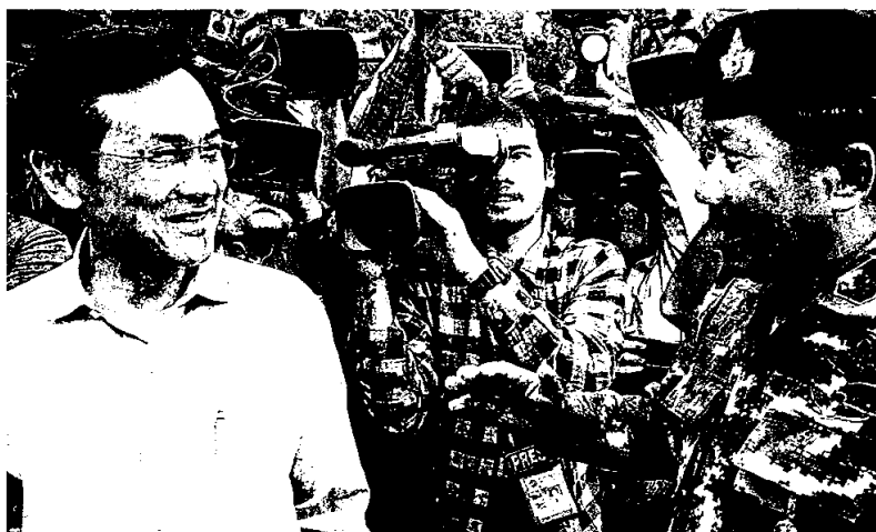
ปรับทัศนคติ นายจาตุรนต์ ฉายแสง อดีตรมว.ศึกษาฯ ถูกทหารจากกองกำลังรักษาความสงบเรียบร้อย (กกล.รส.) โทรศัพท์เข้ามาระหว่างจะเดินทางไปตีต๋องกับเพื่อน เพื่อเชิญมารายงานงานตัวที่กองทัพอากาศที่ 1 หลังโพสต์เฟซบุ๊กแสดงความคิดเห็นทางการเมืองหลายเรื่อง โดยเฉพาะกรณีการถอดถอน น.ส.ยิ่งลักษณ์ ชินวัตร อดีตนายกฯ ในคดีจำนำข้าว

นายวิษณุ เครืองาม รองนายกรัฐมนตรี ให้สัมภาษณ์ถึงสหรัฐฯอเมริกาแนะไทยยกเลิกกัญช้อยการศึกษาว่า การประกาศใช้กัญช้อยการศึกษาไม่ได้เป็นปัญหาเป็นธรรมดาต่างประเทศอาจเห็นเป็นเรื่องใหญ่ แต่โดยในตัวเองแล้วไม่มีอะไร คนที่ไม่ได้อยู่ในเหตุการณ์อาจจะไม่รู้แต่รัฐบาลรู้ว่าอะไรบ้าง วันนี้ยังมีความจำเป็นที่จะพยายามหาวิธีผ่อนคลายนโยบายพุดตามอุดมการณ์ของเขา ไม่ต้องไปเขวเมื่อถามว่าไปสู่อการวิจารณ์ว่ารัฐบาลกล่าวอ้างตระกูลชินวัตร นายวิษณุกล่าวว่า ไม่ใช่ เป็นเรื่องธรรมดาของคนที่ไม่มีสมอง คนที่ได้รับผลกระทบย่อมเกิดสิ่งเรียกว่า อนุญัตถกรรม