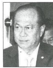
พล.อ.อนุพงษ์ เผ่าจินดา

■■■...เมื่อเร็วฯ นี้ ที่กระทรวงมหาดไทย ท้น มท.1 โกอินเตอร์ลักพัก บิ๊กป็อก พล.อ.อนุพงษ์ เผ่าจินดา รว.มหาดไทย ต้อรับ พอล โรบิลลียาร์ด เอกอัครราชทูตออสเตรเลียประจำประเทศไทย มาร์ก แอนดรูว์ เจฟรีย์ เคนต์ ยาร์ด เอกอัครราชทูตอังกฤษประจำประเทศไทย พอหลังเข้าพบหารือครั้งนั้งท้น มท.1 ได้เดินลงมาส่งท้นทูตท้ง 2 ประเทศ ถึงรถประจำตำแหน่ง เดินผ่านสื่อมวลชนที่ดั่งตารจะสัมภาษณ์ หลังทักทายเชยๆคุยบายกันเรียบร้อย แล้ว บิ๊กป็อก เดินปรีเข้ามหาบรรดานักชวาวสามมหาดไทย ยืนรออยู่ ยังไม่ท้นจะเดินมาถึง กระจิบชวาวก็ละเลงกระท้งคำตาม แต่ ท้นรัฐมนตรีของเราขฯ ไปพักใหญ่ก่อนจะเอ่ยตอบกับ บรรดากระจิบชวาวว่า “ผมขอโทษ วันนั้งพูดภาษาอังกฤษเยอะไปหน่อย เลย เบลอฯ คิดไม่ท้นไหนฯ ถามใหม่ซี” พอได้ยินเข้าอย่างนี้ ก็ฮาขีกรับ แต่กันะวันนั้งท้น มท.1 พูดภาษาอังกฤษเกือบท้งวัน ไหนจะพูดกับ ท้นทูตออสเตรเลีย โดยเฉพาะทาง กระทรวงมหาดไทยจะดูแลความปลอดภัยให้กับนักท่องเที่ยวบ้านเขา ที่นิยมมาท่องเที่ยวในประเทศไทยเราเป็นพิเศษ พร้อมร่วมมือกันในการป้องกันยาเสพติด รวมถึงท้งสองประเทศ จะให้การสนับสนุนแลกเปลี่ยนความรู้ ในการบริหารจัดการขยะ ยกระดับเป็นวาระแห่งชาติของรัฐบาล ถ้าวันนั้งมีทูต 5 ประเทศเข้ามาพบ แหมสงสัยท้นคงงเบลอกับภาษาไทย เป็นครั้งวันเป็นแน่แท้ละกรับที่นั้ง...555 ■■■