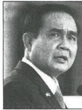
พล.อ.ประยุทธ์ จันทร์โอชา

■■■..ถึงคิวกระทรวงเกษตรฯ เป็นเจ้าภาพ จัดประชุมระดับปลัดกระทรวง และหัวหน้าส่วนราชการ ประจำเดือน ถือเป็นครั้งแรกที่ นายกฯ“ตู” พล.อ.ประยุทธ์ จันทร์โอชา มาอย่างเป็นทางการ หลังรับตำแหน่งผู้นำรัฐบาล..งานนี้ ปิดติ่งค์ ฟุ้งบุญ ฌ อยู่ชยา รว.เกษตรฯมาต้อนรับ แม่บ้าน