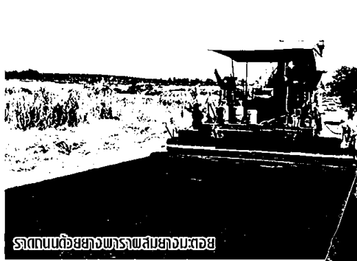
รถถนนด้วยยางพาราผสมยางมะตอย