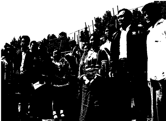
△ แอ้วเหวือ - พล.อ.ประยุทธ์ จันทร์โอชา นายฯ เยี่ยมชมโครงการหลวง สถานีเกษตรหลวงอ่างขาง จ.เชียงใหม่ และเป็นประธานการประชุมคณะกรรมการประสานงานและสนับสนุนโครงการหลวง ครั้งที่ 1/2558 เมื่อวันที่ 17 ก.พ.

บิกตุ้เล็กผูกถึงแม่-ยันไม้ไผ่ตำ เผยชาน-เตียงก็ขอมิตร.ติดทาม ป.ป.ช.ยื่นคำสั่งชี้ทวง‘ปู’ 6 แสนล้าน ค่าแจ้งจำนำ ข้าว จ่อเรียกค่าเสียหายจาก อ่านต่อหน้า 10