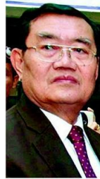
อานวย ปะติเส

6 เรียกได้ว่างาน เข้าตลอด ตั้งแต่ “อานวย ปะติเส” รัฐมนตรีช่วย ว่าการกระทรวง เกษตรฯ หรือฉายา “รัฐมนตรียาง” เข้ารับตำแหน่ง เพราะต้องตาม