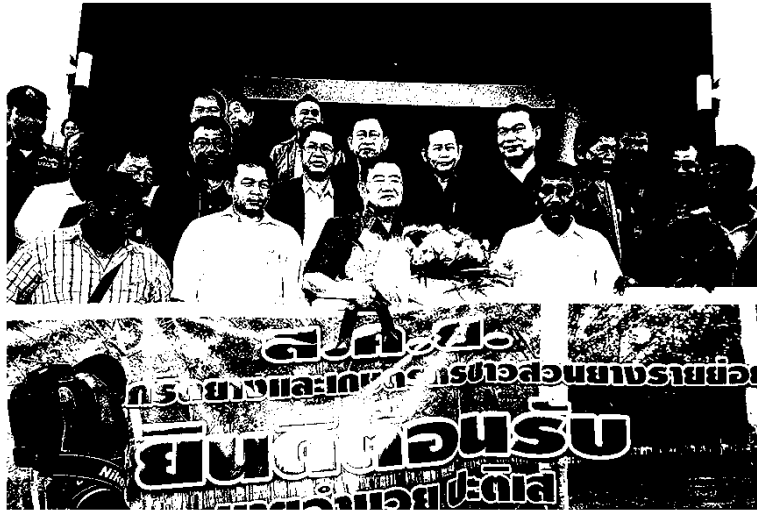
ต้อนรับ - ชาวสวนยาง จ.นครศรีธรรมราช ต้อนรับนายอานวย ปะติเส รมช.เกษตรและสหกรณ์ ระหว่างมาเป็นประธานจัดเวทีระดมความคิดเห็นและข้อเสนอแนะ แนวทางการแก้ปัญหายางพารา ทั้งระบบ ที่มหาวิทยาลัยวลัยลักษณ์ จ.นครศรีธรรมราช เมื่อวันที่ 21 กุมภาพันธ์