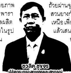
ชวลิต ชูขจร ปลัดกระทรวงเกษตรและสหกรณ์

ดังนั้น กระทรวงเกษตรฯ จึงได้กำหนดแนวทางแก้ไขปัญหามาช่วยเหลือเกษตรกรและสถาบันเกษตรกรกลุ่มน้ำยางสดและยางก้อนถ้วย โดยมอบหมายให้องค์การสวนยางเปิดจุดรับซื้อน้ำยางสด แล้วจ้างโรงงานเอกชนแปรรูปเป็นน้ำยางข้น 60% จำหน่ายออกสู่ตลาด และให้รับซื้อยางก้อน