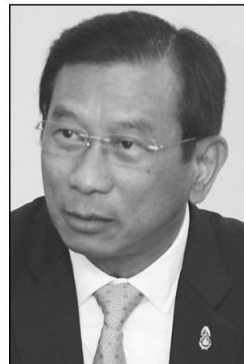
พล.อ.ฉัตรชัย สาริกัลยะ

สำหรับคณะทำงานด้านยางพารา โดยผู้แทนฝ่ายไทยที่หารือคือ องค์การสวนยาง (อสนย.) และบริษัท ซีโนเคิน ของจีน ซึ่งหลักการซื้อขายจะคล้ายกับข้าว แต่ราคาตกลงกันว่าไทยจะขายยางพาราให้ในราคาระดับภาพ 2 แสนตัน ซึ่งเงินตกลงว่าจะเร่งลงนามซื้อขายสินค้าเกษตรทั้ง 2 ชนิด และในวันที่ 12 มี.ค. ทางจีนเข้าหารือร่วมกับกระทรวงคมนาคม เพื่อตกลงรายละเอียดของการลงทุนก่อสร้าง