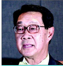
• ม.ร.ว.ปรีดิยาธร เทวกุล

วิกฤติเลยเป็นโอกาสซะงั้น!!.....*◆*.....แต่ผล ไม่ได้ได้นื้อได้หนังหรือรับทรัพย์มากที่สุดได้แก่ ทุเรียน ทั้งนี้เรื่องเลขชา สคก.บอ กเมื่อปี 2557 ที่ผ่านมาเราสามารถส่งออกได้เพิ่มขึ้นถึง 100% โดยลูกค้ารายใหญ่ก็คือ ชาวจีนแผ่นดินใหญ่ ที่ กำลังแหกกันเข้ามาเที่ยวประเทศไทยล้นทะลัก ในขณะนั้นนั่นเอง.....*◆*.....ว่าจะไม่พาดพิง การเมือง แต่ก็อดไม่ได้เมื่อมีข้าราชการระดับสูง กลุ่มแรกได้รับเกียรติ ม. 44 จากท่านผู้นำที่ว่า