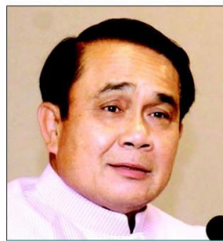
• พล.อ.ประยุทธ์ จันทร์โอชา