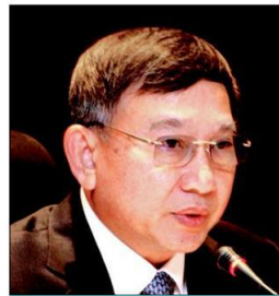
• พล.อ.อ.ประจัน จันตอง

จะใช้สร้างสรรค...งานนี้ระดับบิกๆในกระ ทรวงศึกษาโดนไป 6 ...ไล่ตั้งแต่เบอร์หนึ่ง ตำแหน่งปลัดกระทรวง!!! ยังไม่รู้จะมีกระทรวง อื่นได้รับเกียรติอีกหรือไม่...เพราะต้องไม่ลืมยัง มีแบล็กลิสต์รายชื่อข้าราชการอีกนับ 100 ที่ เกี่ยวข้องกับการทุจริตและประพฤติมิชอบใน การปฏิบัติราชการเข้าไปอยู่ในมือท่านผู้นำ แล้ว...ต้องติดตามชมต่อไป!!.....*◆*.....ไปที่ กระทรวงหูกวาง...หน่วยงานที่มีผลงานค่อนข้าง