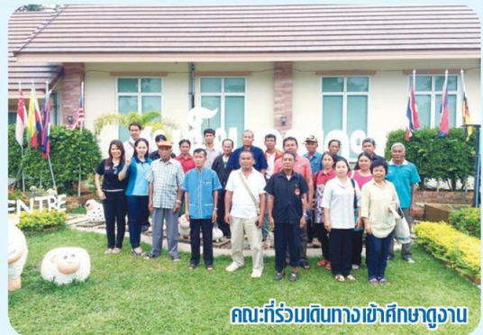
คณะที่ร่วมเดินทางเข้าศึกษาดูงาน

คณะกรรมการบริหารชุดเดียวกัน พร้อมทั้ง จัดให้มีการรวมบัญชีเป็นบัญชีเดียวกัน โดยรวมเงินและรวมสมาชิกเป็นองค์กรเดียวเพื่อประกอบกิจกรรมตามที่ชุมชนต้องการ