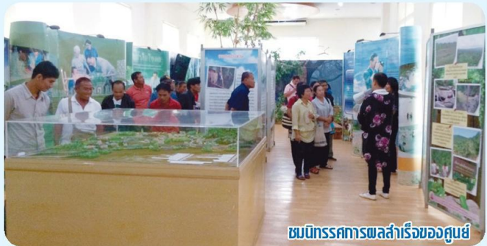
ชมนิทรรศการผลสำเร็จของศูนย์