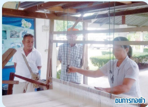
ชมการทอผ้า