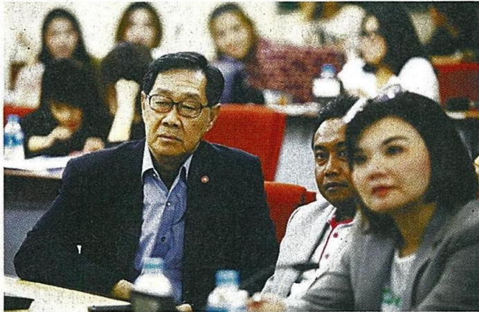
บรรยายศก. : ม.ร.ว.ปริติยารชฐ เทวกุล รองนายกรัฐมนตรี บรรยายภาพรวมการฟื้นตัวและแนวทางการกระตุ้นเศรษฐกิจไทย ในโครงการพัฒนาศักยภาพผู้สื่อข่าวเศรษฐกิจระบบดับสูง ประจำปี 2558

"ฐานทรัพยากรที่มีความสำคัญที่รัฐจะเร่งผลักดันให้สำเร็จคือ อุตสาหกรรมไปแตชที่มีทรัพยากรไปแตชมากถึง 4 แสนล้านตัน