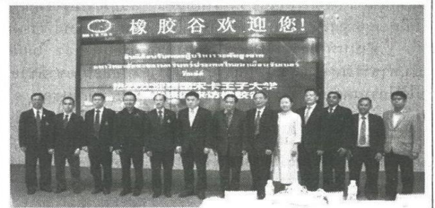
บรรยากาศการถ่ายภาพร่วมกันในการประชุมร่วมกับผู้บริหาร Qingdao University of Science and Technology, QUST และการต้อนรับคณะผู้บริหารระดับสูงของมหาวิทยาลัยสงขลานครินทร์ที่ไปเยือน Rubber valley ณ เมืองชิงเต่า มณฑลซานตง สาธารณรัฐประชาชนจีน เมื่อวันที่ 13-15 ตุลาคม 2558