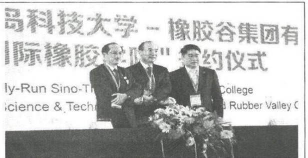
บรรยากาศพิธีลงนามความร่วมมือโครงการความร่วมมือไตรภาคี ระหว่างมหาวิทยาลัยสงขลานครินทร์ร่วมกับมหาวิทยาลัยวิทยาศาสตร์และเทคโนโลยีชิงเต่าและ Rubber valley ณ เมืองชิงเต่า มณฑลซานตง สาธารณรัฐประชาชนจีน