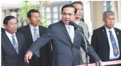
ไมชิตะชัย: พล.อ.ประยุทธ์ จันทร์โอชา นายกรัฐมนตรี แถลงผลการประชุม คณะกรรมการนโยบายยางธรรมชาติ(กนย.) ที่ทำเนียบรัฐบาล

เร่งใช้ยางสร้างถนน ต้นสังกัดส่วนใช้ภายในให้ได้ 30-40% ชูปลดอภิตี กรมทางหลวงหากล่าช้า