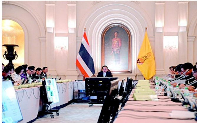
แก้ราคายาง- พล.อ.ประยุทธ์ จันทร์โอชา นายกรัฐมนตรี และคณะรักษาความสงบแห่งชาติ (คสช.) เป็นประธานในการประชุมคณะกรรมการนโยบายยางธรรมชาติ ครั้งที่ 3/2558 ร่วมกับ พล.อ.ฉัตรชัย สาริกัลยะ รัฐมนตรีว่าการกระทรวงเกษตรฯ ที่ทำเนียบฯ

พล.อ.ประยุทธ์ กล่าวว่ วันนี้ตัวแทนทุกกลุ่มมาพูดคุยกันและ พ.ร.บ.การยางออกมาแล้ว ซึ่งทุกคนพอใจ โดยทุกภาคส่วนจะต้องเข้ามามีส่วนร่วมในคณะกรรมการตาม พ.ร.บ.ใหม่ เมื่อคืนตนคุยถึงกลางคืนได้ข้อยุติที่มาพูดคุยกับเขาและไม่มีข้อขัดแย้งใดๆ และรับปากว่าเราจะเดินหน้าในการสร้างความเข้มแข็งทั้ง 3 ส่วน คือ 1.เจ้าของสวน 2.รับจ้างทำ 3.ผู้กรีดยาง แต่เรื่อง