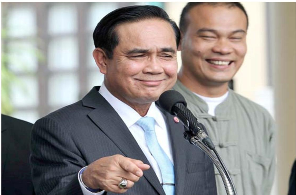
ช่วยสวนยาง - พล.อ.ประยุทธ์ จันทร์โอชา นายกรัฐมนตรี แสดงภายหลังการประชุมคณะกรรมการนโยบายยางธรรมชาติ ครั้งที่ 3/58 ยืนยันว่า รัฐบาลสนับสนุนการสร้างเสริมความเข้มแข็งให้กลุ่มเกษตรกรผู้ผลิตยางดีมีที่