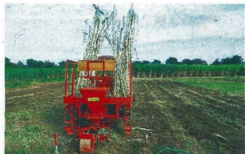
ผลงานวิจัยของศูนย์วิจัยและพัฒนาการเกษตรสุพรรณบุรี

ไม่ว่าจะเป็นพันธุ์ถั่วเขียว 2 พันธุ์ พันธุ์อ้อย 18 พันธุ์ และพันธุ์ข้าวฟ่าง 4 พันธุ์ ทั้งยังมี ผลงานวิจัยเกี่ยวกับการป้องกันกำจัดศัตรูอ้อย