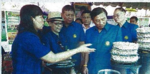
พล.อ.ฉัตรชัย สาริกัลยะ (ที่ 2 จากขวา) พร้อมด้วย สมชาย ชาญณรงค์กุล (ที่ 3 จากซ้าย) ฆมนวัตกรรมและการเพาะถั่วงอกในงานวันถ่ายทอดผลงานวิจัย

พล.อ.ฉัตรชัย สาริกัลยะ รัฐมนตรีว่าการกระทรวงเกษตร