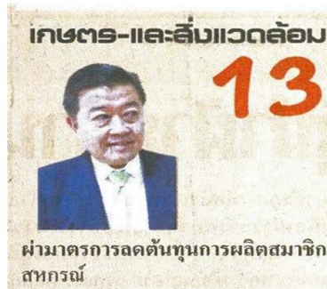
ผ่านมาตรการลดต้นทุนการผลิตสมาชิกสหกรณ์