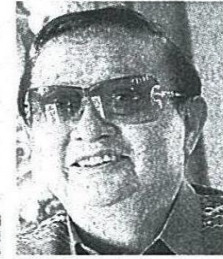
เรืองวิทย์ ลิกค์