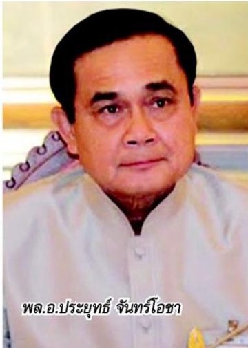
พล.อ.ประยุทธ์ จันทร์โอชา

นำความเดือดร้อน...ของพี่น้องราษฎร..ไปชี้แจงขั้นตอน แก่ผู้บริหารประเทศ น้อยน่ะท่าน