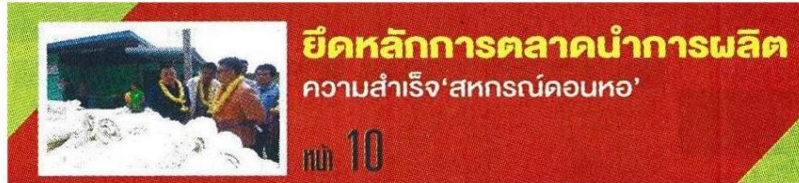
ยึดหลักการตลาดนำการผลิต ความสำเร็จ 'สหกรณ์ดอนหอ'