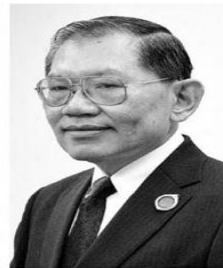
วิชา มหาคุณ

อำนาจทำเองเลย หรืออาจใช้มาตรา 44 ทำก็ได้