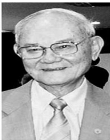
มิชัย ชุชชุนันท์

● กรธ.ประชุมนอกสถานที่ครั้งแรกที่ชะอำ จ.เพชรบุรี 11-17 ม.ค.นี้ มิชัย ชุชชุนันท์ ประธานกรธ.จะเผยแพร่รายละเอียดเป็นรายมาตราที่พิจารณาแล้วเสร็จให้ประชาชนรับทราบก่อนคลอดร่างแรก 29 ม.ค.นี้