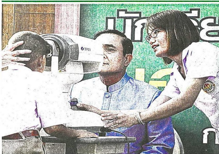
▲ สายตายาว พล.อ.ประยุทธ์ จันทร์โอชา นายกษ ตรวจสอบสายตาโดยแพทย์จาก สถาบันสุขภาพเด็กแห่งชาติมหาราชินี และโรงพยาบาลวัดไร่ขิง พบว่าข้างซ้ายยาว 100 ส่วนข้างขวายาว 250 ก่อนร่วมประชุม ครม.ที่ทำเนียบรัฐบาล.

ปฏิทินคู่ดูโอ “แม่-ปู” แจกกระจายช่วงปีใหม่ บานไม่หุบ “บิกตู” ไม่ปลื้ม ตวาดลั่นมันสมควร ใหม่ คนทำผิด ก.ม.มาแจกปฏิทิน ★ มีต่อหน้า 6