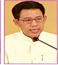
พล.ต.สรรเสริญ

เกษตรและสหกรณ์ทุกคนด้วยว่าจะต่อแท้งน้อยใจไม่ได้ ซึ่งเร็ว ๆ นี้ ปัญหาภัยแล้งก็จะมาอีก และน่าจะหนักกว่าปัญหาหยางพารา แต่ไม่ใช่เรื่องที่เราจะต่อแท้ง ต้องเดินหน้าและมุ่งมั่นต่อไป.....เฮ้อ!!! สุยเลยสู้รับลูกแห่