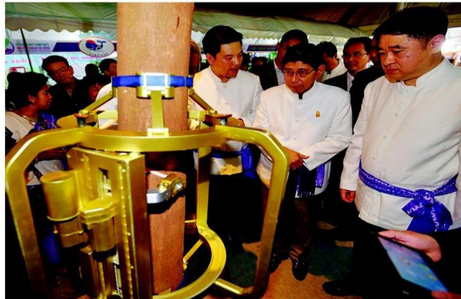
☞ เครื่องกรีต - นายวิษณุ เครืองาม รองนายกรัฐมนตรี ชมการสาธิตเครื่องกรีตยาง ระหว่างเป็นประธานเปิดงานวันยางพาราและกาชาดบึงกาฬ จัดขึ้นระหว่างวันที่ 21-27 ม.ค. ที่สนามหน้าที่ว่าการอำเภอเมืองบึงกาฬ จ.บึงกาฬ เมื่อวันที่ 21 ม.ค.

ถือว่าเป็นปีที่มีความพิเศษคือ ได้รับเกียรติจากเพื่อนบ้านหลายประเทศมากขึ้น จัดงานยิ่งใหญ่ 7 วัน 7 คืน เป็นการยกระดับจากงานยางพาราทั่วไปให้ยิ่งใหญ่ขึ้นในห้วงวิกฤตราคาดต่ำ