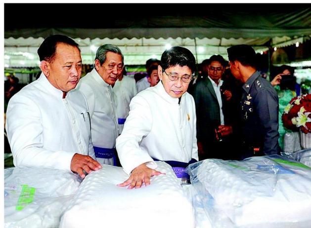
งานยาง - นายพินิจ เครื่องาม รองนายกฯ เดินชมผลิตภัณฑ์ยางแปรรูประหว่างเป็นประธานเปิด “งานวันยางพาราและกาชาดบึงกาฬ 2559” มีนายพินิจ จารุสมบัติ อดีตรองนายกรัฐมนตรี นายพินิจ คนชัยัน นายก อบจ.บึงกาฬ และคณะให้การต้อนรับ บริเวณสนามหน้าที่ว่าการอำเภอเมือง บึงกาฬ เมื่อวันที่ 21 มกราคม

น.ส.ปานบัวกล่าวว่า นิทรรศการฝากไทยที่นำมาจัดแสดงในงานวันยางพาราและกาชาดบึงกาฬ นับเป็นครั้งแรกที่มีการส่งมอบมาภาคตะวันออกเชิงเหนือ เนื่องจากบึงกาฬตั้งใจตั้งแต่ครั้งจัดที่กรุงเทพฯ จึงให้ทีมงานประสานไปที่ “ศูนย์บันดลไทย” กระทรวงวัฒนธรรม เพื่อทำเรื่องขอยืมของมาจัดแสดง ซึ่งก็ได้รับความอนุเคราะห์ด้วยดี สาเหตุที่เลือกมาให้ชาว