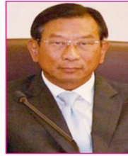
พล.อ.ฉัตรชัย

●●.....แหงะๆๆๆ แต่ก็มีกระแสะข่าวออกมาเข้าเก้าอี้รัฐมนตรีว่า “บักฉัตร” พล.อ.ฉัตรชัย สาริกัลยะ รมว.เกษตรและสหกรณ์ น้อยชกน้อยใจจนคิดว่าจะลาออกจากเก้าอี้ ทำให้พี่ใหญ่บูรพาพยัคฆ์อย่าง “บักป้อม” พล.อ.ประวิตร วงษ์สุวรรณ รองนายกรัฐมนตรีฝ่ายความมั่นคงและรมว.กลาโหม ต้องรีบปลอบใจเองชวยว่า ทหารบางครั้งมีน้อยใจกันบ้าง แต่ต่อแท้งไม่ได้ ต้องสู้ไป ส่วนเจ้าตัว “บักฉัตร” ยืนยันว่าไม่น้อยใจ จะยังทำหน้าที่ต่อไป ขณะเดียวกันได้ให้กำลังใจข่าวสารของกระทรวง