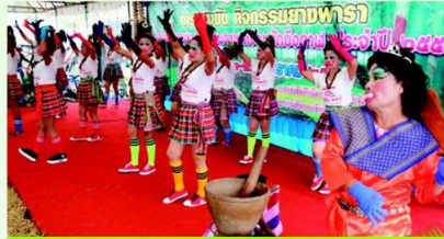
สีสั้นกองเชียร์ขางพารา

ก็นำมาจัดแสดงเป็นตัวอย่างอาทิหมอนที่นอนสนามเด็กเล่น ยางบีบมือเพื่อสุขภาพ ถูงมื่อ ผ้าเคลือบยางพาราอเนกประสงค์ ยางบริหารร่างกาย ฯลฯ รวมถึงการใช้วีร้อมสาริตเป็นครั้งแรกของนวัตกรรมเครื่องกีดขวางอัตโนมัติของกลุ่มรีเบอริ์ วัลเลย์ ประเทศจีน