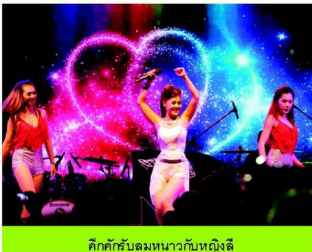
ศึกษากับลหมานวกับหญิงลี