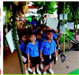
น้อง ๆ สนใจนิทรรศการเกษตรมหัศจรรย์