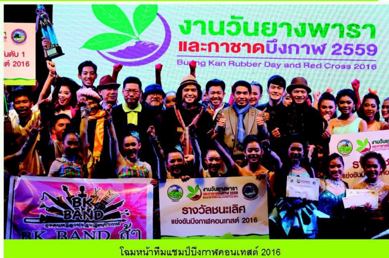
โฉมหน้าทีมแชมป์บึงกาฬคอนเทสต์ 2016

เวียนมาบรรจบพร้อมสายลมหนาว งานประจำปีของดีริมโขงของพี่น้องชาวจังหวัดที่ 77 ภายใต้การผลักดันอย่างแข็งขันของคณะเจ้าภาพ จังหวัดบึงกาฬ องค์การบริหารส่วนจังหวัดบึงกาฬ เหล่ากาชาดจังหวัดบึงกาฬ หอการค้าจังหวัดบึงกาฬ และการสนับสนุนอย่างดียิ่งจากหน่วยงานภาครัฐและเอกชนหลายแห่งจัดขึ้นอย่างยิ่งใหญ่สมศักดิ์ศรีดินแดนที่ปลูกยางพารามากที่สุด เมื่อวันที่ 21-27 มกราคมที่ผ่านมา ณ สนามหน้าที่ว่าการอำเภอเมืองงานวันยางปีนี้จัดภายใต้แนวคิด “เมืองแห่งยางพารา การค้า และการท่องเที่ยว” พร้อมกับการมุ่งเน้นสู่การยกระดับเกษตรกรและแก้ไขปัญหาวิกฤตยางพาราอย่างยั่งยืนจากการลดต้นทุน เพิ่มมูลค่าจากการแปรรูปเป็นสินค้าต่างๆ พร้อม