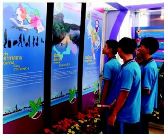
นิทรรศการโครงการในอนาคตของบึงกาฬ