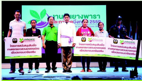
เกษตรกรได้รับการสนับสนุนสินเชื่อเพื่อประกอบอาชีพเสริมจาก ธกส.