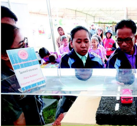
โมเดลจำลองถนนทำจากยางพารา