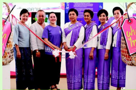
เปิดนิทรรศการ "ฝากไทย"