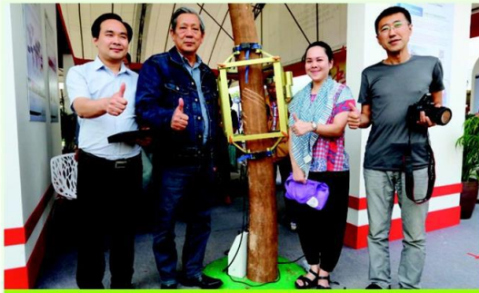
นวัตกรรมเครื่องกรีดยางอัตโนมัติ