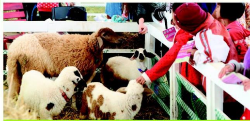
นิทรรศการสวนขางพาราแบบผสมผสาน ด้วยการปลูกพืชร่วมและเลี้ยงสัตว์