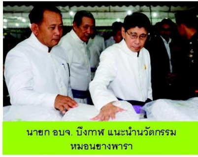
นายก อบจ. บึงกาฬ และนางนวัตกรรม หมอนขาวพารา

และมาเลเซีย ที่สนใจมาเยี่ยมชมงาน และมีเลขาธิการกรอบความร่วมมือเอเชีย ACD มาร่วมงานเป็นปีแรก กิจกรรมและสาระความรู้ ทั้งหมด ยังเป็นการช่วยจุดประกายความหวัง ให้แก่พี่น้องเกษตรกรยางพาราชาวบึงกาฬ เพื่อให้เป็นอีกแนวทางร่วมแก้ปัญหาภัยพารา โดยมีจังหวัดบึงกาฬเป็นโมเดลนำร่องในการ แก้ปัญหาภัยพาราอย่างยั่งยืนต่อไป