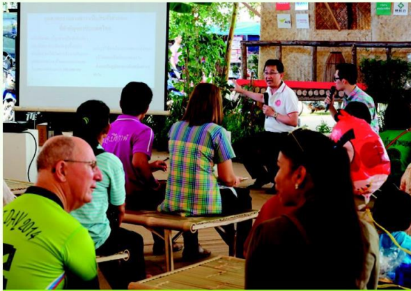
ฟังเสวนากับปราชญ์ชาวบ้าน