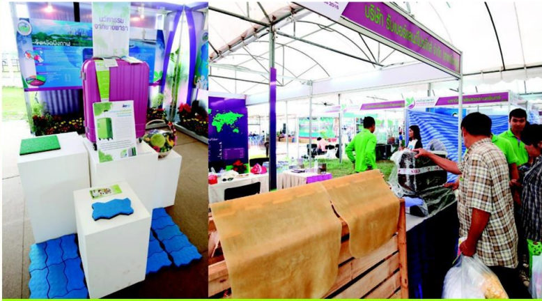
จัดแสดงนวัตกรรมแปรรูปจากขางพารา