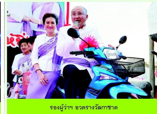
รองผู้ว่าฯ อุดรราชวิทยาลัย

ตลอดทุกวันนี้ภูวด้านการเกษตร เกษตรกรตัวอย่าง กลุ่มโอท็อป มาอู่เขต ความรู้และประสบการณ์ในหัวข้อต่างๆ มีการจัดอบรมอาชีพเด่นโดยเซฟชื่อดังจาก มติชนอคาเดมี การแข่งขันกรีดยางชิงแชมป์ ระดับอาเซียน นิทรรศการฝากไทยสัญจร เป็นครั้งแรกของอีสาน พร้อมกับช่วย สร้างสีสันความสนุกสนานทุกค่ำคืนกับ