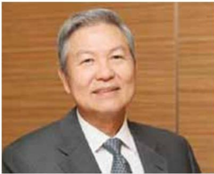
กวาง กัม ฮอน

● นายกวาง กัม ฮอน นักธุรกิจถุงมือยางสังเคราะห์วัย 68 ปี มหาเศรษฐีอันดับ 11 ของมาเลเซียขยับขึ้นมามีอันดับมหาเศรษฐีฟอร์บส์เป็นครั้งแรกในปีนี้ ด้วยสินทรัพย์ 1,100 ล้านดอลลาร์ (39,600 ล้านบาท) สืบเนื่องจากรายได้ และผลกำไรที่เติบโตอย่างรวดเร็วขึ้นของฮาร์ทาเลกา โฮลดิ้งส์ บริษัทผลิตถุงมือยางสังเคราะห์ ที่ก่อตั้งขึ้นเมื่อปี 2531 ส่งออกถุงมือยางสังเคราะห์ไปยัง 40 ประเทศทั่วโลก