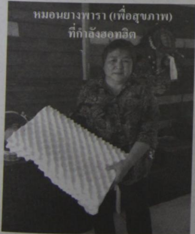
หมอนยางพารา (เพื่อสุขภาพ) ที่กำลังฮิตอีก

พร้อมกันนี้ ผอ.กลุ่มอุตสาหกรรมยาง กยท. ยังได้พูดถึงการแปรรูปผลผลิตต้นทางอย่าง น้ำยางสด ที่มีการผลิตเป็น "ยางแผ่นดิบ-ยางแผ่นรมควัน" รวมถึงการทำเป็นขี้ยางหรือ "ยางก้อนถ้วย" ที่เกษตรกรบางพื้นที่มองว่าช่วยลดต้นทุนการผลิตนั้น โดยสามารถยกระดับการผลิตเพื่อเพิ่มโอกาสการตลาดที่ดีกว่า กล่าวคือ อย่างกรณีของยางแผ่นดิบ และยางแผ่นรมควัน จากเดิมการกำหนดคุณภาพโดยแบ่งเป็นยาง