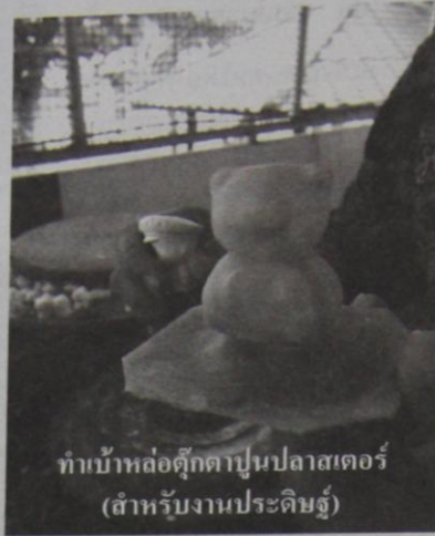
ทำบ้าหล่อตุ๊กตาปูนปลาสเตอร์ (สำหรับงานประดิษฐ์)