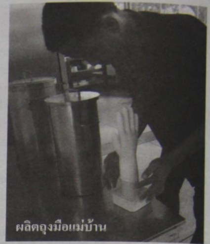
ผลิตถุงมือแม่บ้าน

ชุมชน เอสเอ็มอี (SMEs) จนไปถึงในระดับของโรงงานอุตสาหกรรมขนาดใหญ่ นอกจากนี้ ยังมีงานบริการทดสอบมาตรฐาน โดย Lab ที่ได้มาตรฐานสากล การตรวจรับรองมาตรฐาน GMP (Good Manufacturing Practice) สำหรับกระบวนการผลิต เป็นต้น