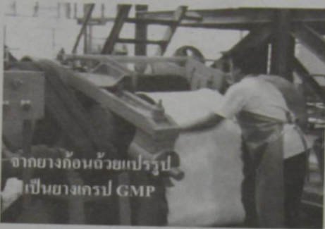
หากยางก้อนถ้วยแปรรูป เป็นยางเครป GMP

ชั้นต่างๆ เพื่อการกำหนดราคาซื้อขาย และสำหรับการส่งออก (ยางแผ่นรมควัน) ตลาดปลายทางจะกำหนดสเปกให้พร้อมมีการอัดก้อนตามมาตรฐาน ส่วนกรณีของขี้ยางหรือยางก้อนถ้วยที่รับซื้อโดยโรงงานยางอัดแห้ง จะมีปัญหาเรื่องกลิ่น (เหม็น), สิ่งเจือปน (ความสกปรก) และความชื้น ซึ่งทำให้ถูกกดราคาอย่างไม่เป็นธรรมอยู่บ่อยครั้ง ดังนั้น จากความสำเร็จในการยกระดับรายได้ของกลุ่ม/สถาบันเกษตรกรที่มีความเข้มแข็งสามารถส่งออกยางได้หลังผ่านการรับรองมาตรฐาน GMP โดยสถาบันวิจัยยาง การยางแห่งประเทศไทย (กยท.) ที่ได้ดำเนินการออกใบรับรองให้แล้วสำหรับโรงงานยางอัดก้อนจำนวน 11 แห่งทั่วประเทศ ภายใต้มาตรการที่เข้มงวดจนได้รับการยอมรับคุณภาพจากตลาดปลายทางที่ซื้อขาย นำมาสู่การขยายผลต่อไปยัง "ยางแผ่นรมควัน GMP" และยางก้อนถ้วยที่จะทำในรูปแบบของ "ยางเครป GMP" โดยมีการควบคุมคุณภาพมาตั้งแต่ในระดับแปลงผลิตด้วยมาตรฐาน GAP (Good Agricultural Practice) รับรอง เพื่อการนำไปใช้สำหรับ