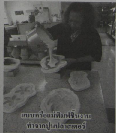
แบบหรือแม่พิมพ์ชิ้นงาน ทำจากปูนปลาสเตอร์