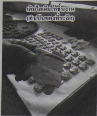
เดิมทีเดียวให้ชิ้นงาน (ทำเป็นของที่ระลึก)