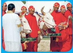
ภาพชุด พระราชพิธี พืชมงคลฯ หน้า...2