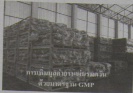
การเก็บมูลค่าอย่างเหมาะสมกับ ด้วยมาตรฐาน GMP