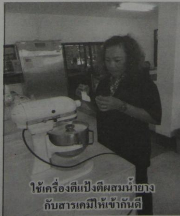
ใช้เครื่องตีแป้งผสมน้ำยาง กับสารเคมีให้เข้ากันดี