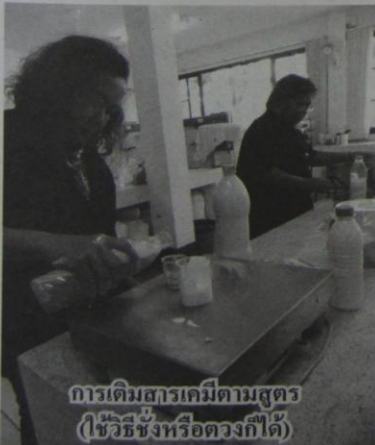
การเติมสารเคมีตามสูตร (ใช้วิธีชั่งหรือตวงก็ได้)