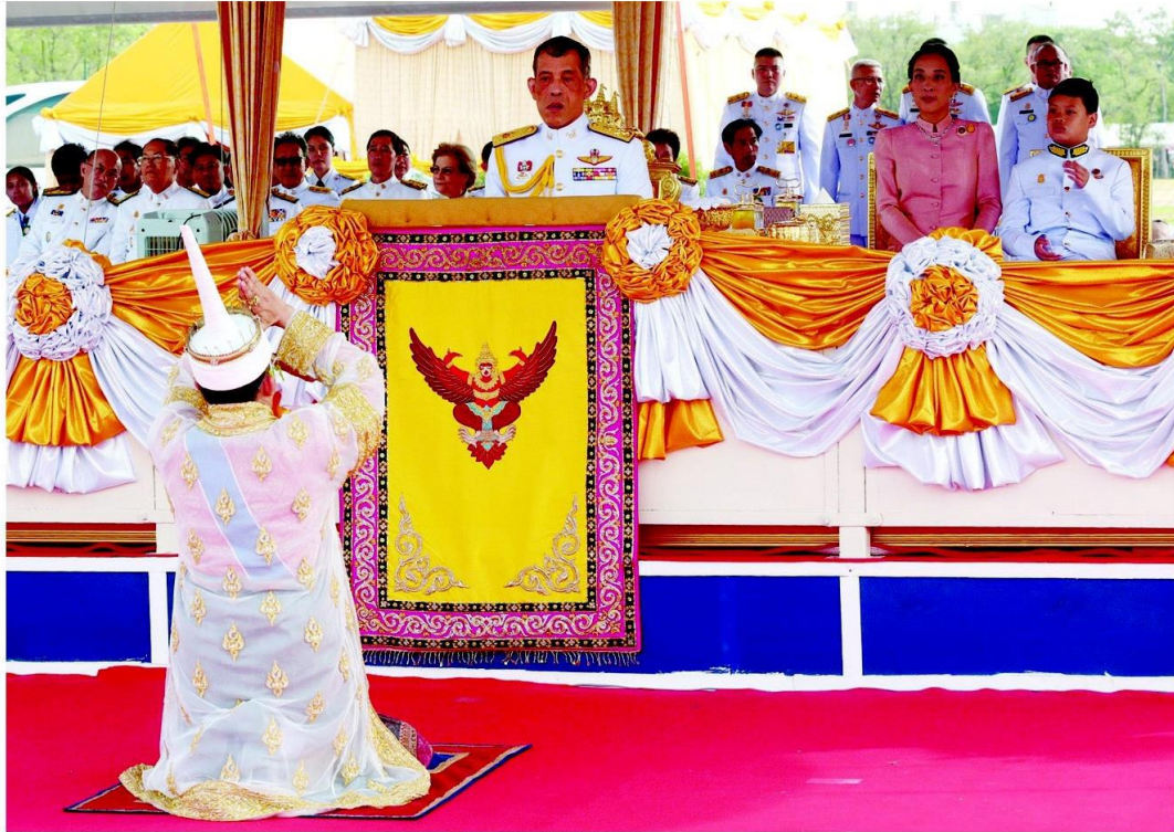
สมเด็จพระบรมโอรสาธิราชฯ สยามมกุฎราชกุมาร เสด็จฯแทนพระองค์ พร้อมด้วยเจ้าหลานเธอ 2 พระองค์ ในวาระพระราชพิธีพืชมงคลจรดพระนังคัลแรกนาขวัญ ที่มณฑลพิธีท้องสนามหลวง เมื่อวันที่ 9 พ.ค.

พระโคกินเหล้า ซีศก.จะรุ่งเรือง ‘สมเด็จพระบรมฯ’เสด็จพระ ราชดำเนินพร้อมด้วยพระเจ้า หลานเธอ 2 พระองค์ ในวาระ พระราชพิธี อ่านต่อหน้า 16