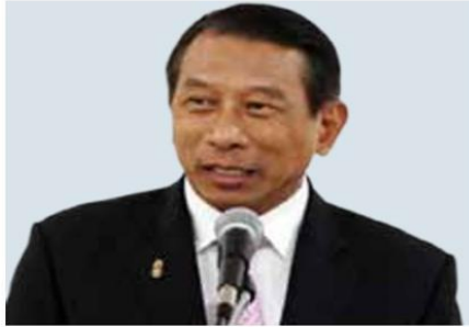
พล.อ.ฉัตรชัย สาริกัลยะ

‘ฉัตรชัย’บินร่วมคณะนายกาเยื่อนอินเดีย พร้อมเจรจาขอให้อินเดียเปิดตลาดนำเข้ายางจาก ไทยเพิ่ม หลังพบอินเดียนำเข้ายางจากอินโดนีเซีย เป็นหลัก