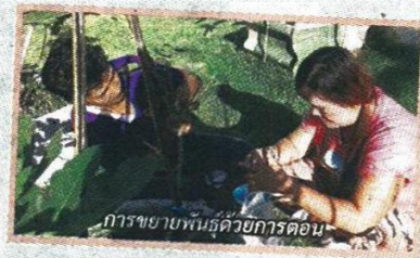
การขายพันธุ์ด้วยการตอน

อยู่กับสายพันธุ์แต่ละชนิดของมะเดื่อฝรั่งด้วย อย่างที่สวนของเธอตอนกิ่งมาแล้ว 9 เดือนสามารถขายกิ่งพันธุ์ออกมาได้จำนวนมาก โดยสมาชิกนำไปปลูก