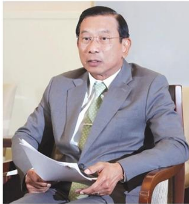
• พล.อ.ฉัตรชัย สาริกัลยะ

ทั้งนี้ ได้พิจารณาแยกประเด็นปัญหาเป็น 2 กลุ่ม คือ กลุ่มที่ 1 ประเด็นที่ตกลง