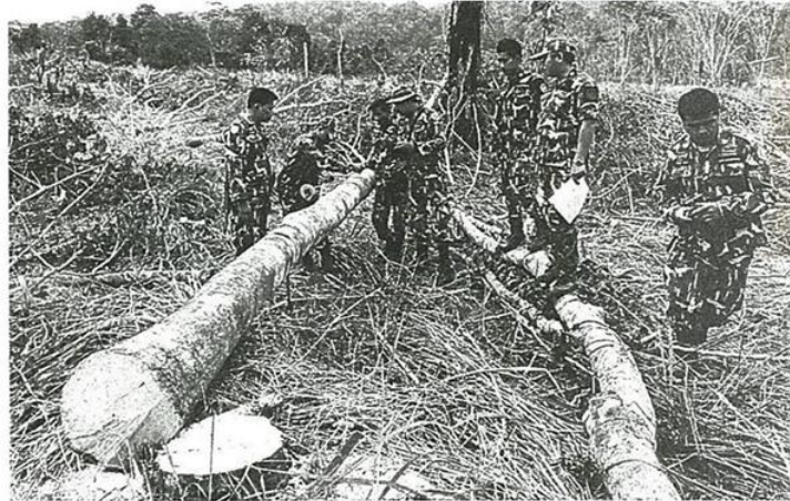
สวนยางรุกป่า นายชัยวัฒน์ คู่มลิจิตอักษร หัวหน้าชุดพญาเสือ พร้อมเจ้าหน้าที่อุทยานแห่งชาติลำคลองงู ตรวจสอบที่ป่าบ้านคลิตีบน หมู่ 4 ต.ชะแล อ.ทองผาภูมิ จ.กาญจนบุรี อยู่ในพื้นที่อุทยานฯลำคลองงู หลังมีนายทุนบุกรุกปลูกสวนยางพารา 50 จุด รวมเนื้อที่ประมาณ 529 ไร่.